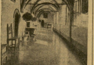
Una bella galería del claustro del Colegio de San Clemente.

Restauró la iglesia gótica para que luciera su puro estilo, descubriendo maravillosos frescos, importantísimos en la historia de la pintura bolonesa de aquel siglo. Una lámpara monumental conmemorativa de la visita que hizo al Colegio Carlos V, cuando en 1530 fue a Bolonia para recibir de su nieto, el papa Clemente VII, la corona imperial. En una de las salas del colegio de grandes dimensiones el señor Carrasco ha reunido todo lo que se refiere al colegio.