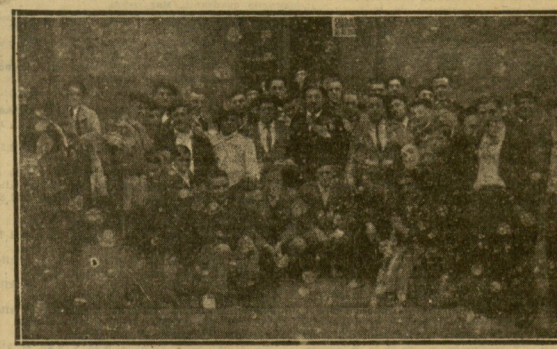
TOLESA — Escenas del penúltimo Carnaval tolosano. "Disputas para el gozaritiki".