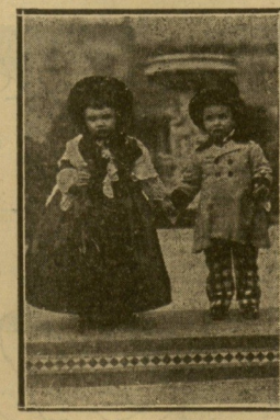
Una pareja muy solemne en el Parque de Alderdi.

Cuantos informes se deseen se facilitarán en la Secretaría del Centro Católico (Guetaria, 15, teléfono 19965) todos los días de siete a nueve de la noche.