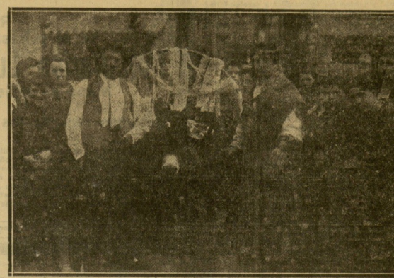
TOLESA — Gitanos ambulantes, que llamaron la atención.