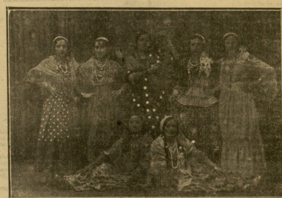
GARNAVAL TOLOSANO. — Bellas tolosanas vestidas de gitanas. — (Foto Arrillaga; Tolosa).