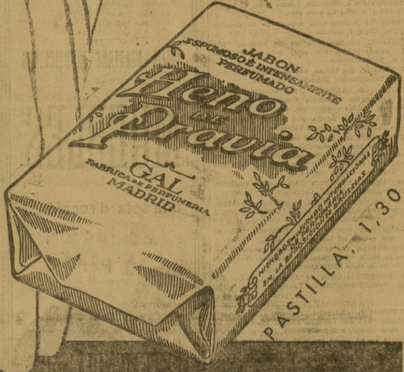
PERFUMERIA GAL-MADRID-BUENOS AIRES

CUTIS En la suavidad y tersura del cutis, se conoce la acción del Heno de Pravia, el jabón de los finos aceites y del perfume singular.