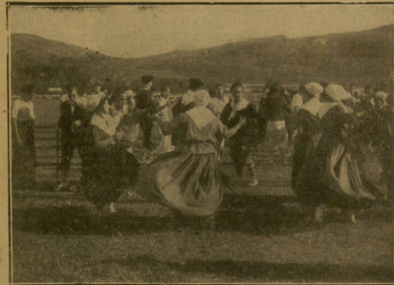
Un momento de la reunión de Lasarte.

El equipo de Orío logró desempatar con el tan-