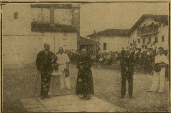
El ángelus en el partido de rebote, en Zubieta.

La concurrencia que acudió fué enorme. A pesar de que la mayoría de los romeros se trasladó a pie, los trenes especiales llegaron abarrotados, y los automóviles y autobuses ordenados en el exterior del Hipódromo, llegaban casi al centenar. Amenizaron la fiesta los "tastularis" de San