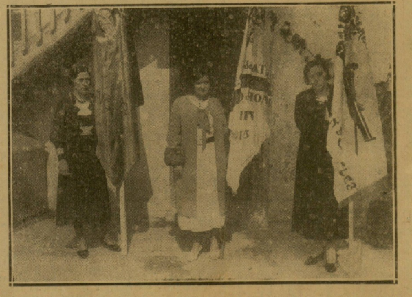
Las tres banderas que los romeros de Orío han ganado en las sucesivas regatas de este año.