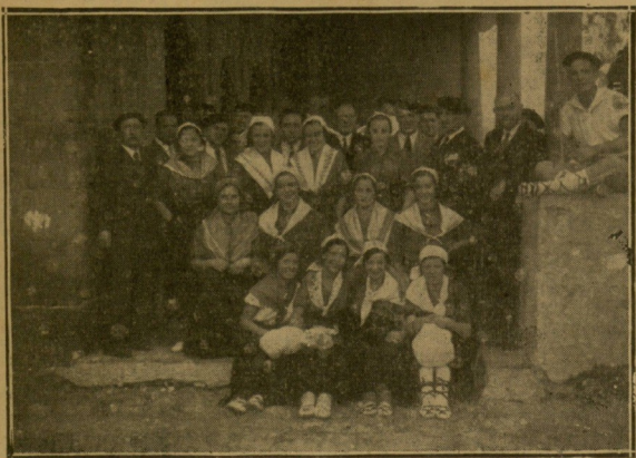
El Comité de la Semana Vasca con un grupo de lindas "cashertas".

Los festejos celebrados el domingo pasado, fueron un gran remate de esta VII Semana Vasca, que con tanto éxito ha servido de cohesión al terreno vasco.