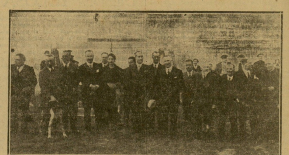
Las autoridades, técnicos y directivos en el acto de colocar la primera piedra del nuevo campo de tiro de pichón en Igueldo.