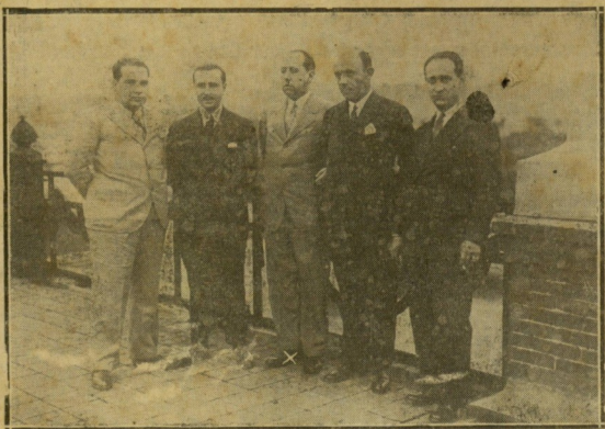
El señor Gil Robles (X) con un grupo de amigos, en su breve descanso de San Sebastián.

No se trata de sacar más o menos actos, sino de hacer un recuento de votos y denunciar el cambio de opinión. Puntos de vista de un castellano sobre los Estatutos. Duración, deberes y figuras de las actuales Cortes. Interesantes datos sobre las responsabilidades.