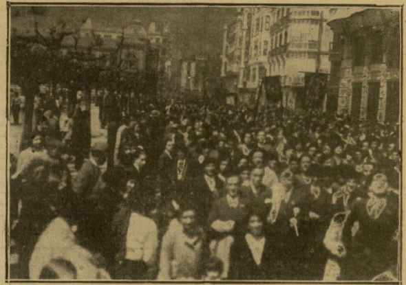
SAN SEBASTIAN. — Un aspecto de la manifestación del viernes.