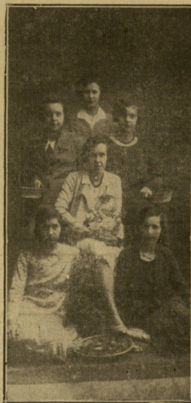
EBAR. — Señoritas eibarreses que, con motivo del 1.º de mayo, tomaron parte en la Fiesta del Clavel.