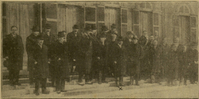
El nuevo Gobierno francés, con su presidente, el señor Laval (x), que acaba de obtener un triunfo en el Parlamento