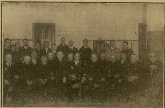
Autoridades e invitados con los ancianos marinos a los que se ha concedido pensiones este año.