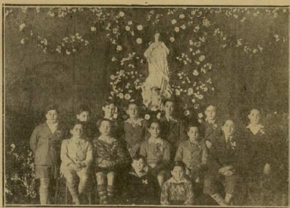
Grupo de alumnos del Colegio de San Ignacio, por cuya designación de dignidades se celebró la fiesta literario-musical el domingo.