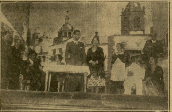
TOLOSA. — Los distinguidos intérpretes de "Para ti es el mundo", en la velada de la Cruz Roja de Tolosa.