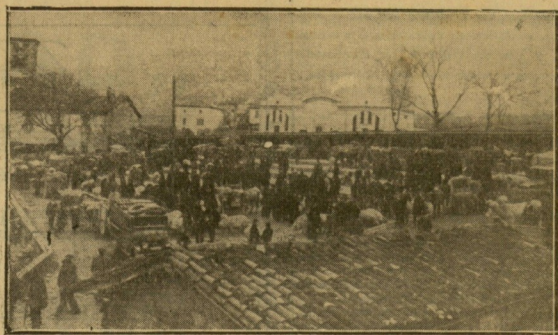
IRUZUN (Navarra). — Vista parcial del mercado de ganado vacuno.