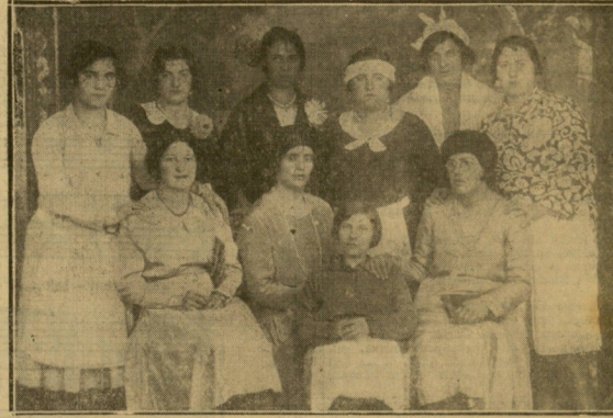
Grupo de enfermeras del Hospital de Manteo que el día del santo de la Rvda. M. Superiora, obsequiaron a ésta con una artística velada.

La única solución posible y que tendría que llegar si se quiere poner Banda en Zumaya, es para a los músicos lo que piden, pues de otra manera es imposible resolver este asunto; no hay que hacerse ilusiones, ahora los músicos no van a tocar por afición, van a por los cuartos; pues la poca afición que restaba a nuestro jóvenes músicos, se echó a perder alguien que hoy está ausente. Creo que habrá llegado hasta el alcalde el clamor de indignación del pueblo por este deshecho de lo, que parece no tiene solución posible, pero no quiero cejar ni unos ni otros, pero que se resolvería rápidamente si cediera el Ayuntamiento en sus objeciones, ya que el Ayuntamiento con el alcalde a la cabeza, fueron los causantes de este deshecho asunto. — BOLONKI.