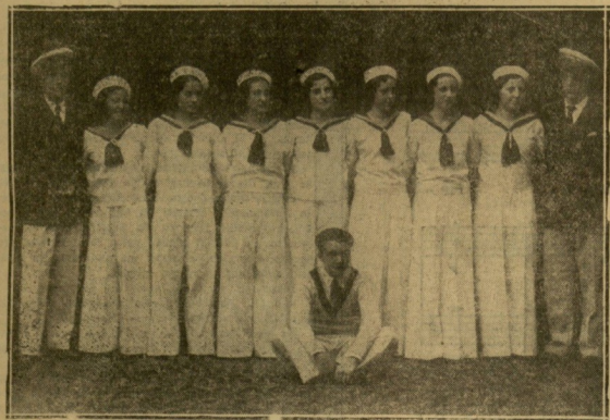
TOLOSA. — Grupo de bellas marianas que formó también parte en la función teatral de Tolosa.