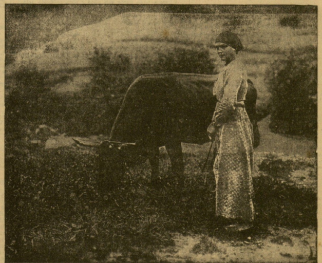
ESCENAS DEL PAIS.