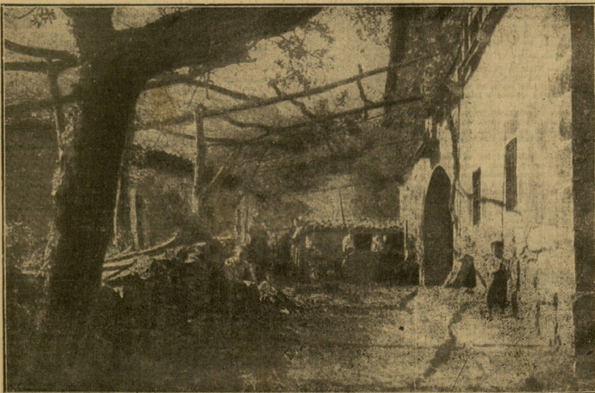
BINCONES VASCOS. — Un caserío en las inmediaciones de Durango.