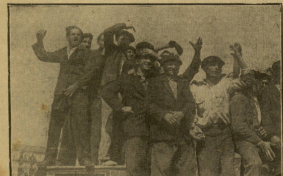
El entusiasmo de los espectadores presencian de la regata de traineras desde lo alto de un camión.

Dr. ARRIETA Ojdo, nariz, garganta. Prim, 19. Tel. 1-06-44.