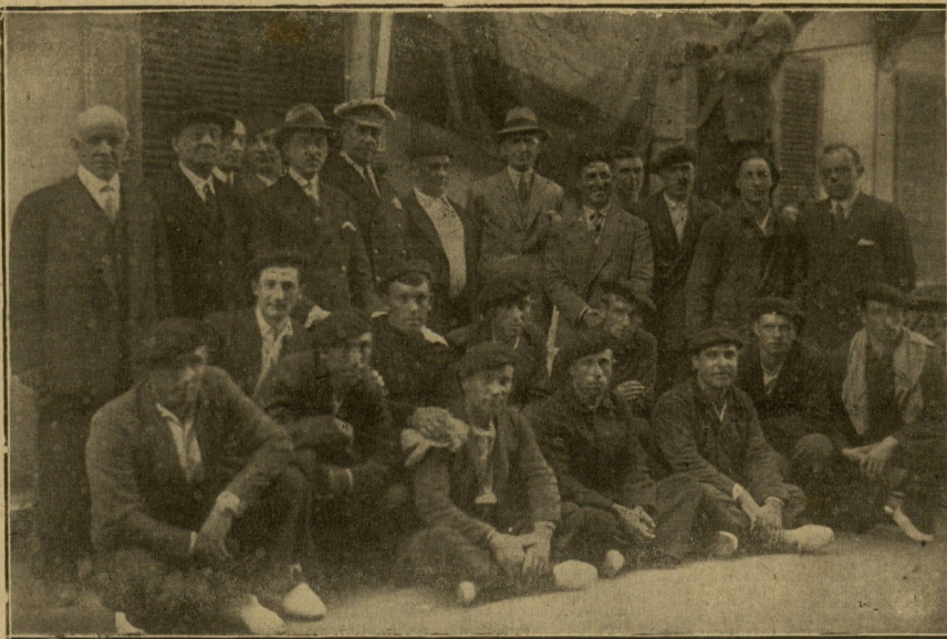
EL ALCALDE, LAS AUTORIDADES Y LOS REMEROS DE SAN PEDRO.

La función de anoche, patrocinada por la excelentísima Diputación de Guipúzcoa y el excelentísimo Ayuntamiento de San Sebastián, fué organizada como homenaje de la Colonia hispanoamericana al pueblo español, en las personas de Sus Majestades los Reyes y Altezas Reales.