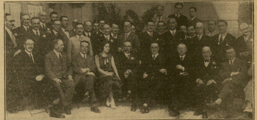
ABOGADOS FRANCESES Y ESPAÑOLES QUE SE REUNIERON EN AFECTUOSO BANQUETE.