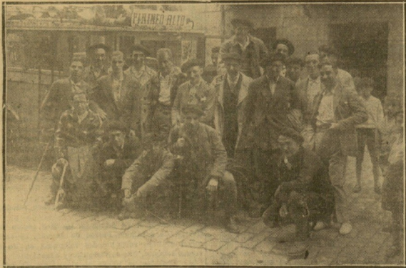
Distinguidos y valientes alpinistas tolosanos que han emprendido el viaje a Jaca, para llegar a las famosas cumbres del Balaitas (Altos Pirineos).