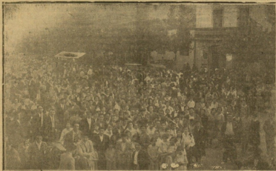
DE LAS FIESTAS DE VILLABONA. — Animo del aspecto que ofrecía la Plaza de Villabona con motivo de las fiestas de Santiago.