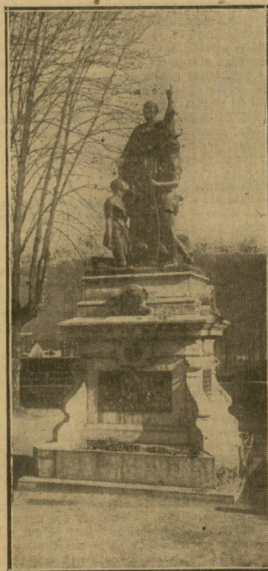
VILLAFRANCA. — Monumento a Urdaneta, hijo ilustre de Ordizia.