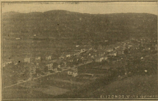
Vista general de Elizondo, que ha celebrado sus fiestas patronales.