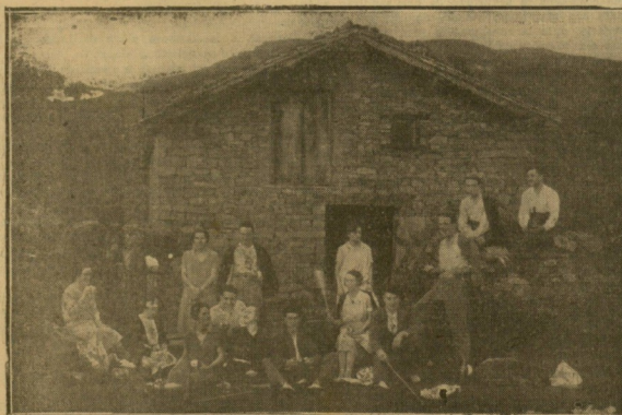
ELEZONDO. — Una taberna en la Casa de España.