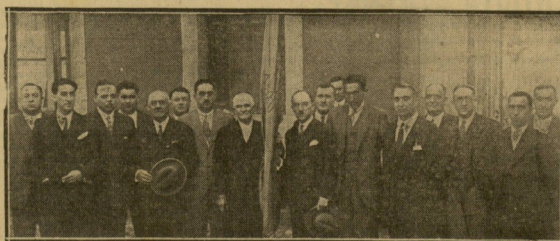
Entrega de la corbata que el Ayuntamiento donostiarra regala a la bandera de los remeros oriotarras.

Puerto de Pasajes. — Movimiento de buques registrado ayer en este puerto: Entradas: Ninguna. Salidas: "Basán", para Bilbao, con resto de carga.