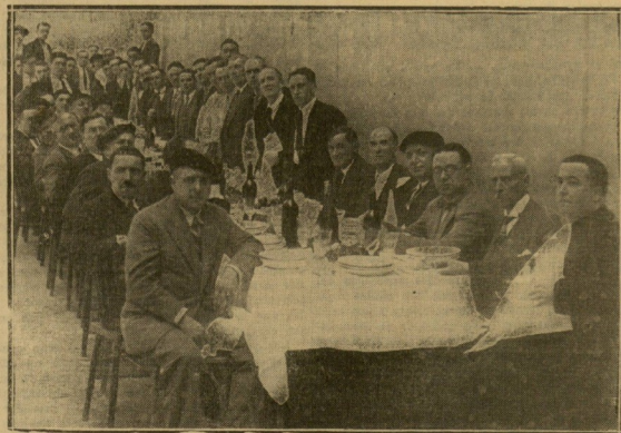
Presidencia del Banquete jaimista que el domingo se celebró en Zaldivia.