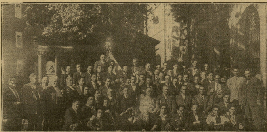
GUERNICA. — La Euskal-Billera, en su jtra, a Guernica, ante el roble tradicional.

ción, 14 horas, 00 minutos, o 92 %. Evaporación, 1'4 mms.