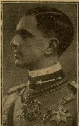
El príncipe Humberto de Italia, que va a casarse con la princesa de Bélgica y que ha sido objeto de un atentado en Bruselas.

Invita a los fascistas a que hagan nueva expresión de su adhesión al rey y saluden entusiastamente al príncipe heredero.