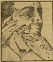
Una rápida pasada y listo para el día

LA PERSONALIDAD es un factor esencial en todos los órdenes de la vida. Para todos los que descuellan, el afeitado diario es tan importante como cualquier otro detalle de la higiene personal. «Es blanda su barba o dura? Use hojas Gillette legítimas y obtendrá un afeitado rápido y suave.»