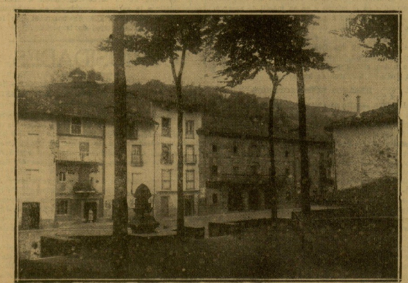
PLAZA DE ANZUOLA.