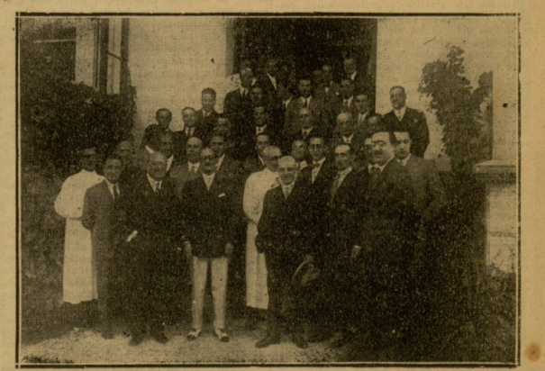
LAS «JORNADAS MEDICAS» EN SAN SEBASTIAN. — Un grupo de doctores que toman parte en las interesantes sesiones que se están celebrando.

En Sevilla, Valladolid, Logroño, Barcelona, Pamplona y otras ciudad se celebraron actos análogos.