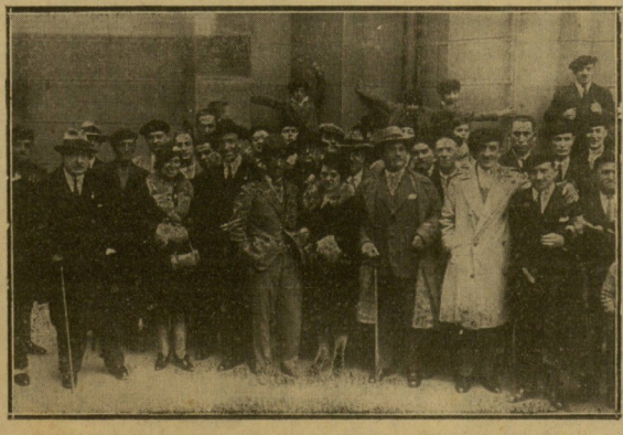
LA COLONIA ALAVESA AL SALIR DE LA IGLESIA DEL BUEN PASTOR.

AVENIDA, 37 y URBIETA, 1. Gran surtido en objetos para regalos, joyería, bisutería, porcelana, cristal, sport, etc., etc., a precios sin competencia. Coches para niños.