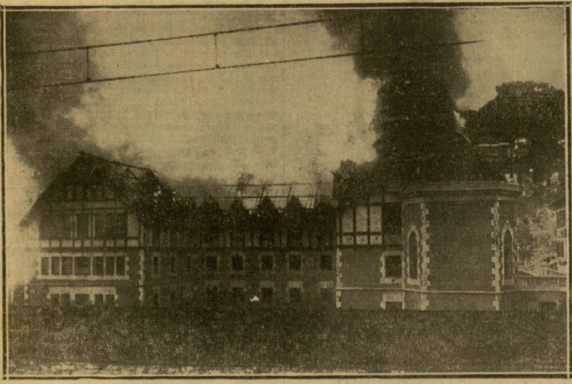
Vista del Convento de las Adoratrices durante el fuego.

Las pérdidas son grandes y no calculadas todavía Las religiosas y las educandas han sido albergadas en las villas contiguas