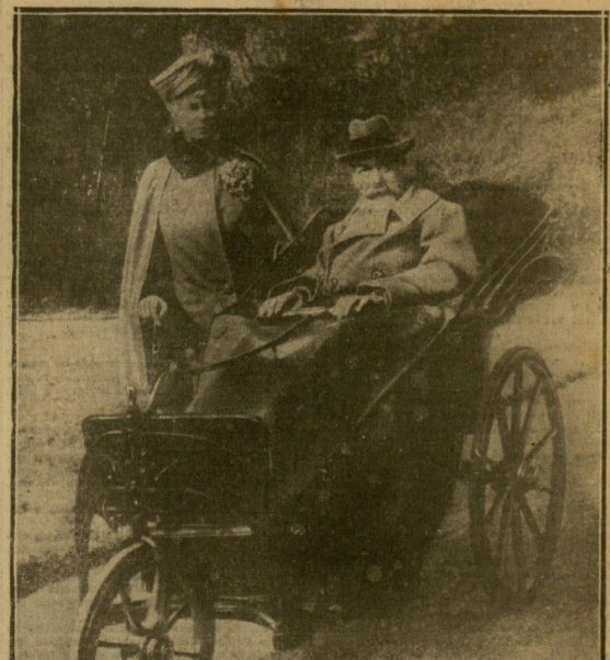
El telegramo nos da cuenta de cómo el Rey Jorge, aprovechando la bondad del tiempo, había salido a pasear al aire libre en un coche por el parque de Craigwell House, en Deesburg, lugar elegido por los médicos para la convalecencia. He ahí al Monarca inglés en ese su primer paseo, acompañado por la Reina.