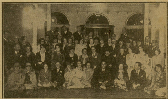
Invitados a la boda Maeso - Doucoux celebrada en San Sebastián.