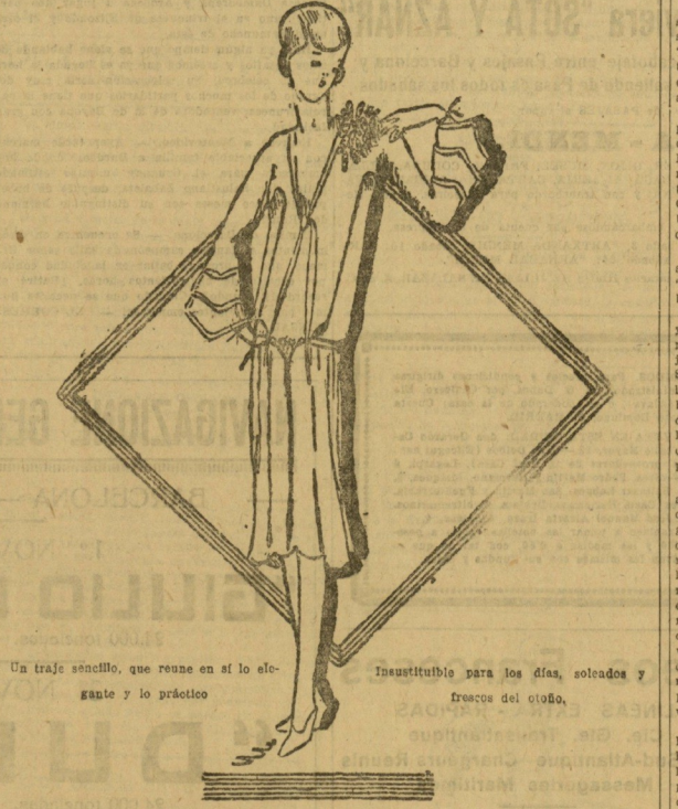
Un traje sencillo, que reúne en sí lo elegante y lo práctico. Insustituible para los días, soleados y frescos del otoño.