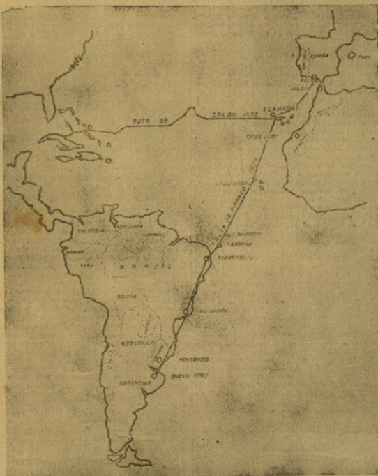
LA RUTA DE LAS DOS EXPEDICIONES DE PALOS: COLON Y FRANCO.

Rogativas por el éxito, con asistencia de la familia de Franco. Detalles de la primera etapa. Gran confianza.