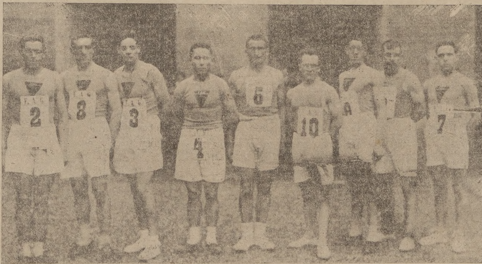
EQUIPO DE LA F. A. G. QUE OBTUVO EL PRIMER PUESTO EN LA CLASIFICACION POR FEDERACIONES.