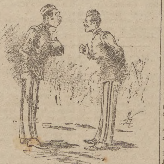
—De parte del sargento Ezpeleta que varias esta noche á caza del coroné, que tienen banquete. —¿Y debo ir yo al banquete? —¿¿, hombre, á servir la mesa! (De "Nuevo Mundo").