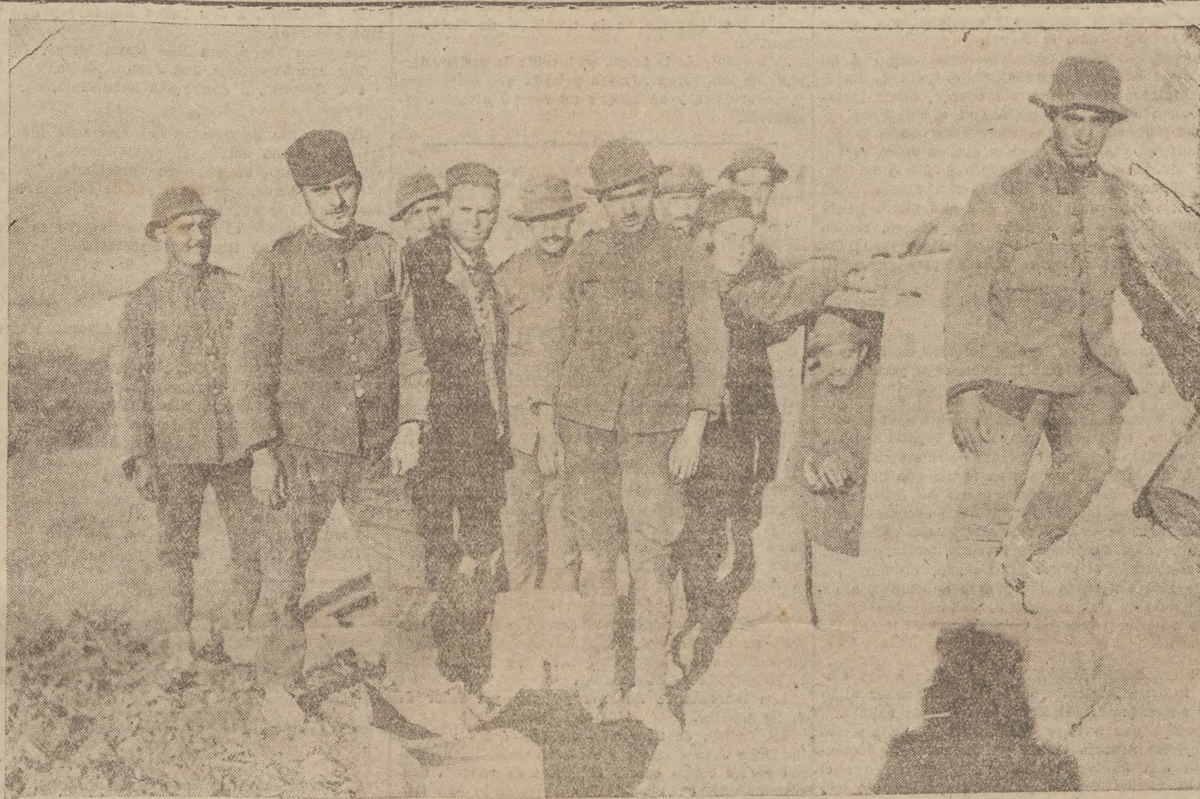
ESCENAS DE CAMPAMENTO. — El segundo batallón de Sicilia en Zoco - en - Arbaa. (De nuestro servicio concertado con "PHOTO-CARTE").

Respecto á que venga la semana próxima el general Berenguer, manifestó que no podía decir ni sí vendría ni si no vendría; y, por último, calificó de infundios las noticias últimamente circuladas, pareciéndole muy bien que con ellas se haya divertido la gente.