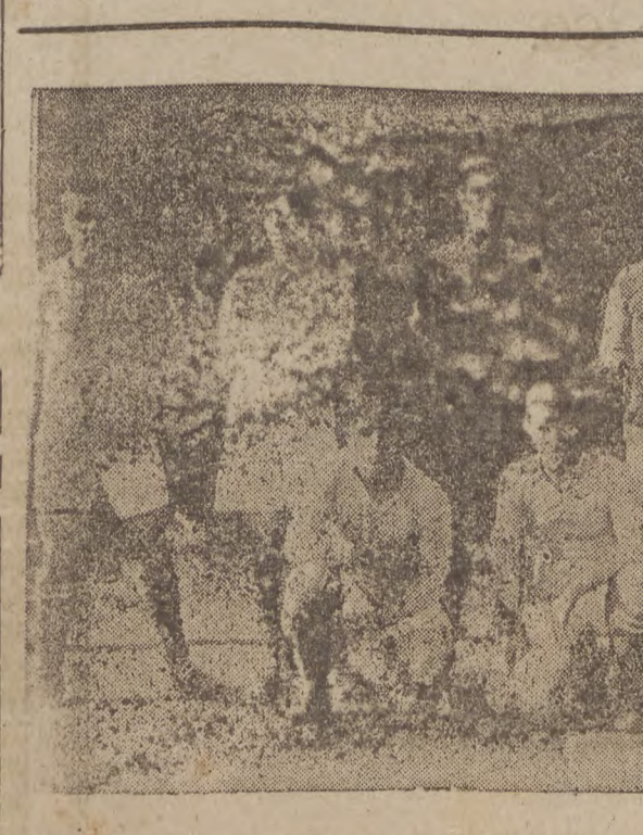
El "C. D. Luchana", de San Sebastián, campeón de segunda categoría de Guipúzcoa.

La estadística de los goals arroja el siguiente resultado: Patrio: 56; Maritorea, 19; Chapartegui, 19; Matias, 17; Amanagui, 15; Iriarte, 9; René, 8; Estomba, 8; Sistilaga, 5; Eceiza (E.), 5; etc., etc.