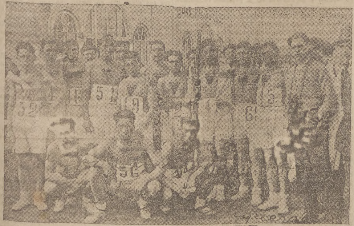
Equipo representativo de Guipuzcoa en el VI "Cross" Nacional celebrado en Santander, vencedor del campeonato de España.