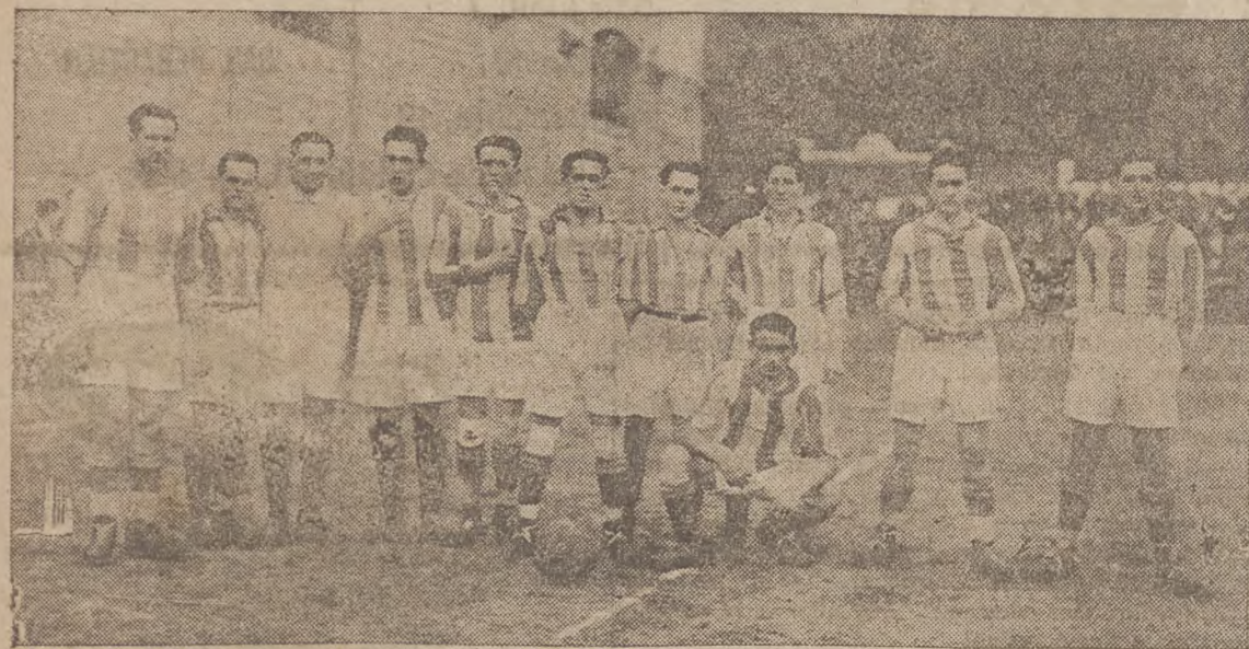
LA "REAL SOCIEDAD DE FOOT - BALL" DE SAN SEBASTIAN.