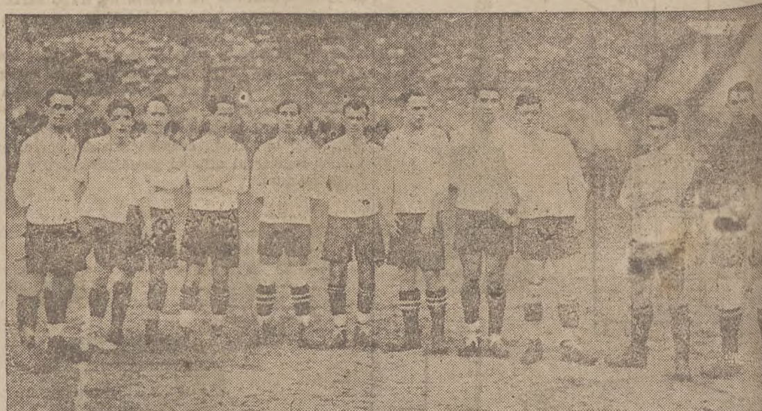
EL "REAL UNION CLUB" DE IRUN, CAMPEON DE GUIPUZCOA.

de las enseñanzas técnicas referentes al juego, cuidado de las lesiones de los jugadores; hay que procurar que en vez de cinco ó seis equipos actúen diez, quince ó veinte, realizando con ello el ideal del deporte que es el que sea practicado por el mayor número de individuos, entre los cuales será siempre más fácil establecer la selección de los mejores y por último llegar contando con reservas adecuadas para ello, a poner precios mínimos, cualquiera que sea la importancia de los equipos contratados. Como se ve se trata de una labor árdua.