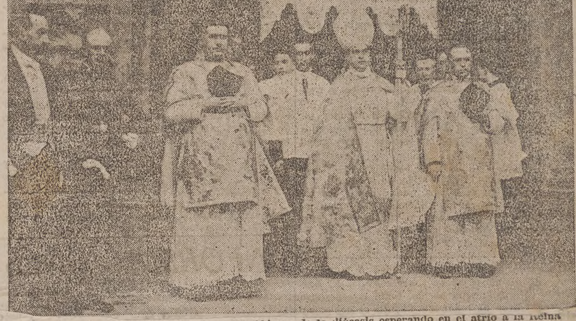
LA SALVE EN SANTA MARIA. — El Obispo de la diócesis esperando en el atrio a la Reina doña María Cristina.

La Comisión de la Asociación de Obreros Católi- cos y del Sindicato Católico de Ferrovíarios Espa- ñoles invita al vecindario á los funerales.