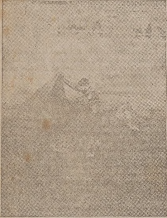
Una verónica de Varelito.

de la importancia de ésta, no hay duda que lo destinó el ganadero por ser de buena nota. Si en el ruedo hubiera estado algún torero, la corrida hubiera lucido muchísimo más.