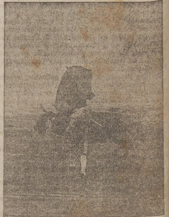
Freg en un pase por alto.