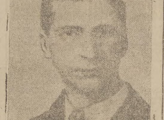
De Valera, el Presidente de la República irlandesa, que en estos días constituye la actualidad extranjera.

Todos los pasajeros de los botes citados, entre ellos el primer oficial, perecieron ahogados. Prontamente, el agua fué penetrando en el departamento de máquinas del "Santa Isabel", inundándolo por completo e inutilizando el dinamó. Por ello, el barco quedó a