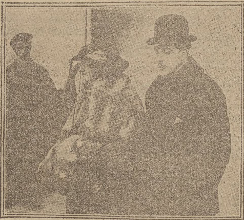
El ex Rey don Manuel de Portugal y su esposa, á bordo del barco que le condujo á Douer. Como se comprende, carecían de fundamentos los rumores que circularon presentando á la joven princesa como resuelta á no reanudar la vida matrimonial, interrumpida por la enfermedad que, á raíz de la boda, le obligó á acogerse á un sanatorio.

Ya han salido para unirse á la escuadra algunos buques, entre ellos uno hospital, para seis mil plazas.