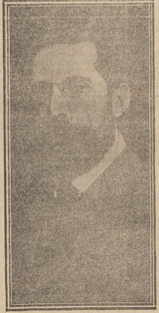
EL MAESTRO ARBÓS.

beró nuestra opinión. Es una composición hermosa presentada con todos los más refinados procedimientos modernos, llena de color, un cuadro en una palabra, arrebatado del natural con métrica natural y delicada poesía. Fué tocada con inimitable gusto y el público aplaudió extraordinariamente.