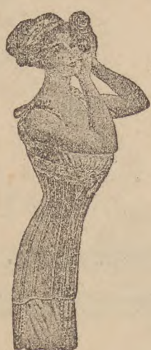
ACUTI SUPERIOR ROSA. Azul blanco mastic todo ballena, desde 7,50 pts.