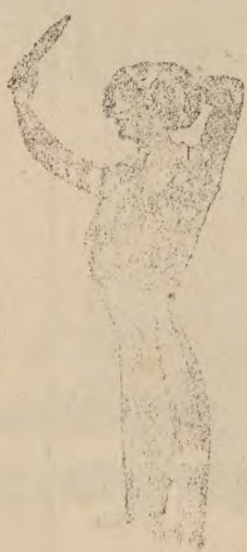
TRICOT HIGIENICO. Rosa azul, blanco y mastic desde 20 pesetas.