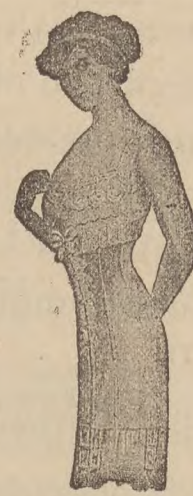
CUTI, FORMA RECTA. la más nueva, Rosa, azul, blanco, mastic, todo ballena, desde 5 ptas.

IMPORTANTE. — Llamo la atención de las señoras, que los CORSES SOBRE MEDIDA, confeccionados en mis talleres llevan la marca registrada de esta casa y nada tiene que ver con otra similar fácil de confundir. Tampoco tiene esta casa ningún otro despacho en San Sebastián.