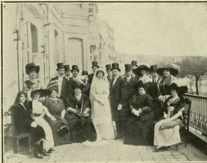
Los desposados y sus padrinos, rodeados de un grupo de invitados, en la terraza del hotel de Londres, en San Sebastián.

UNA gentil pareja, y á fé que nunca estuvo mejor aplicado el calificativo, muy conocida y generalmente estimada de la aristocracia donostiarra, quedó unida, el miércoles pasado, por lazos sagrados é indisolubles. Los desposados fueron apadrinados por el padre de la novia y la madre del novio y el acto religioso tuvo lugar en la iglesia de San Vicente. De todo corazón nos asociamos al júbilo que hoy sienten las familias de los contrayentes.