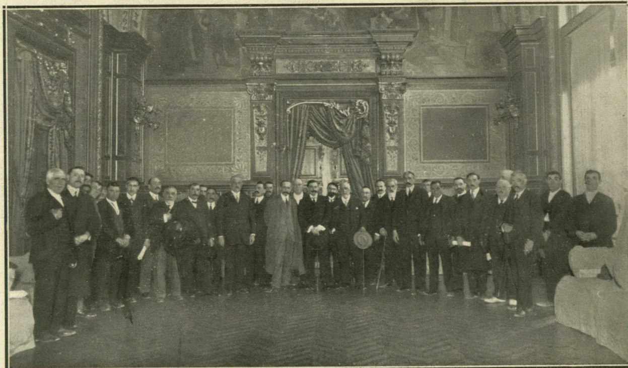
En el salón de actos del Palacio provincial, en Bilbao, se reunieron, conforme á lo acordado, los alcaldes de los diecisiete pueblos que componen este distrito, para proceder á la comparación de los catastros que se han formado de la riqueza rústica, urbana, pecuaria é industrial y proceder á la depuración de estos trabajos. Presidió el acto el diputado provincial Sr. Alonso.