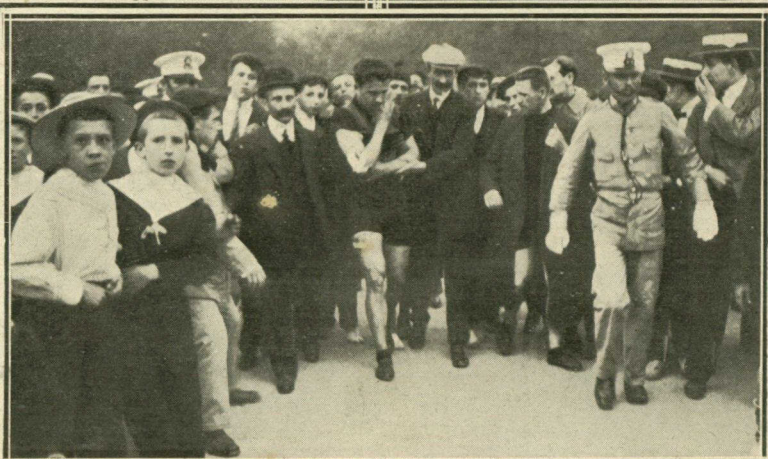
El corredor francés Mr. Fournous conducido para ser curado de las heridas que se produjo al caerse por haber sufrido averías la máquina en el último viraje.

E l lunes pasado se terminó el gran Concurso internacional de «Lawn-tennis» que organizó San Sebastián Recreation Club y que ha venido constituyendo uno de los principales atractivos de nuestra sociedad elegante durante varios días en los Campos de Sport de Ondarreta.