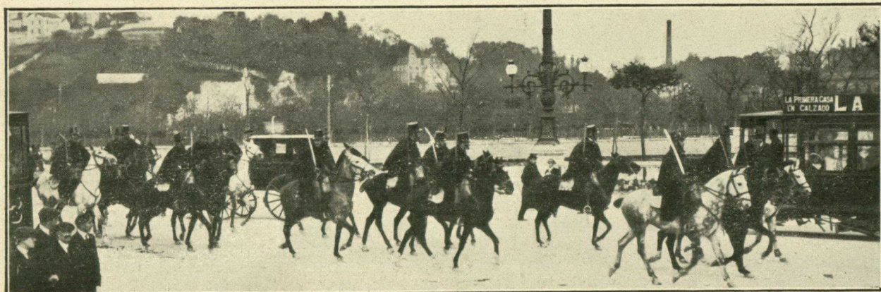
Entrada en la Avenida de la Libertad de los alumnos de Caballería, procedentes de Tolosa.

un lunch , que tuvo lugar en el restaurant del monte Ulía. Suponemos que habrán quedado satisfechos de su estancia en la bella Easo, así como nosotros nos hemos considerado honrados con su visita.