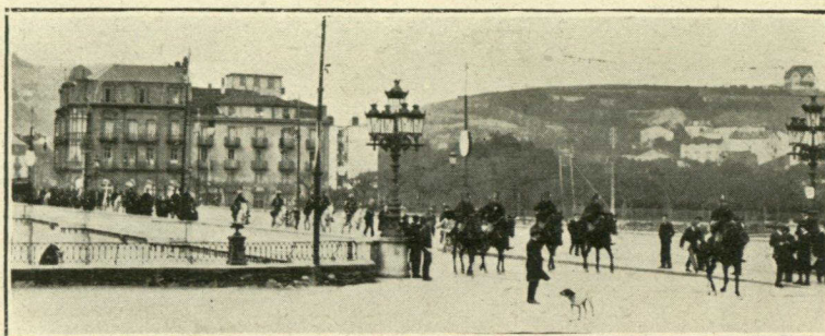
Paso por el puente de Santa Catalina.

La estancia de tan simpático elemento en nuestra ciudad ha