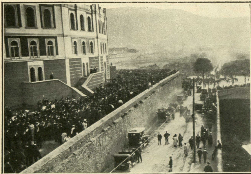
Salida del público de la plaza de Vista Alegre.

lesto paraguas. Los toros es el espectáculo que siempre resulta más perjudicado con estas intemperancias del tiempo, aunque la afición no se arredra por chaparrón más ó menos, como puede verse en nuestros fotografados. Y como con los toros ocurrió con las carreras de bicicletas y los demás números del programa de festejos, todo lo cual se llevó á efecto con gran éxito. «Cocherito», el ídolo de los taurinos «chimbos», aparece en nuestra plana con arrestos que acreditan su arte.