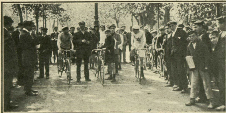
Salida de los corredores de la carrera ciclista celebrada el 5 de Mayo último, con gran animación.