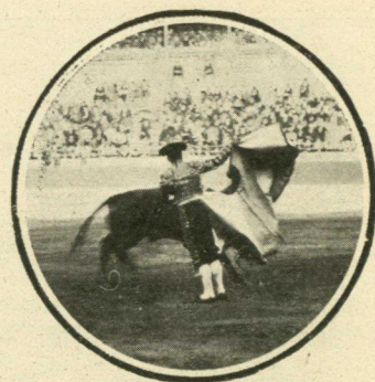
Cocherito, lanceando al tercero de la tarde.

lesto paraguas. Los toros es el espectáculo que siempre resulta más perjudicado con estas intemperancias del tiempo, aunque la afición no se arredra por chaparrón más ó menos, como puede verse en nuestros fotografados. Y como con los toros ocurrió con las carreras de bicicletas y los demás números del programa de festejos, todo lo cual se llevó á efecto con gran éxito. «Cocherito», el ídolo de los taurinos «chimbos», aparece en nuestra plana con arrestos que acreditan su arte.