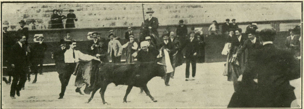
Un momento interesante de la lidia del primer novillo en la becerrada del lunes último.