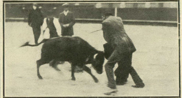
«Taleguilla» entrando á matar el novillo.