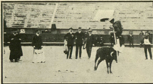
Un aficionado dando el salto de la garrocha.