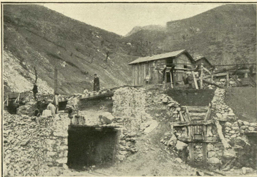
Clasificación á la salida del filón «Primero treinta».