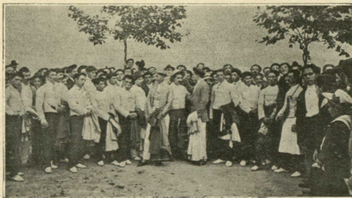
Los lidiadores antes de empezar la corrida.

Esta identificación explica el recibimiento magno que el pueblo de San Sebastián tributó la semana pasada al gran músico francés y las entusiastas aclamaciones de que