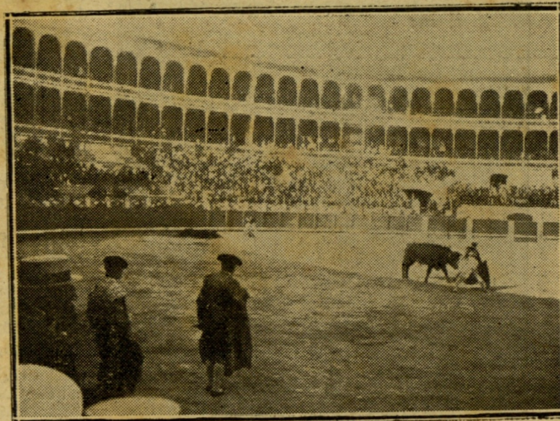
Joselito toreando de muleta

Cocherito se ha portado mejor de lo que esperábamos;