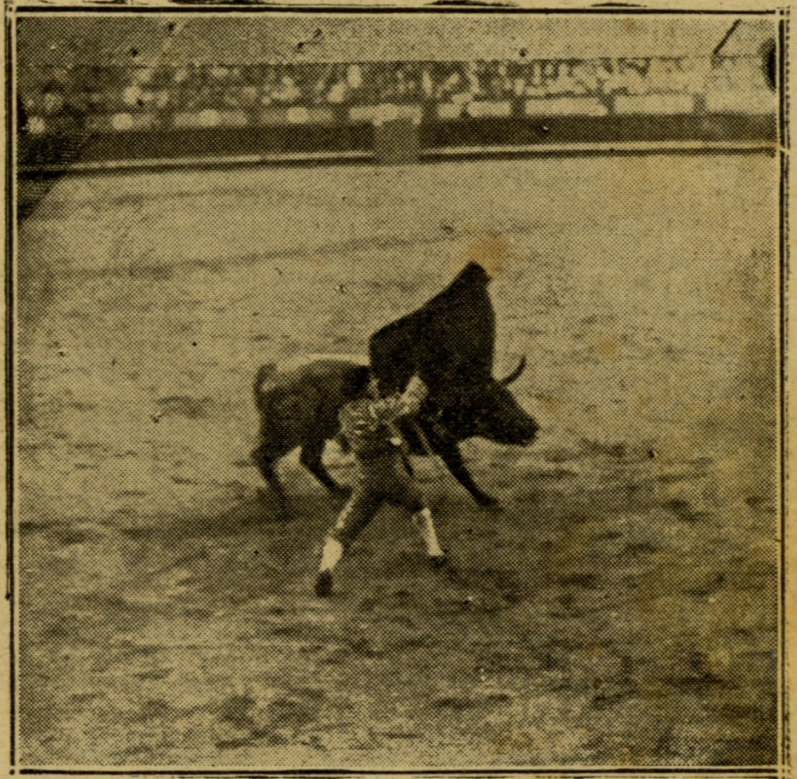
Blanquito en un pase

A banderillas y a la muerte llegaron bravos y suaves. Fué, en conjunto, un ganado para que los chicos se lucieran.