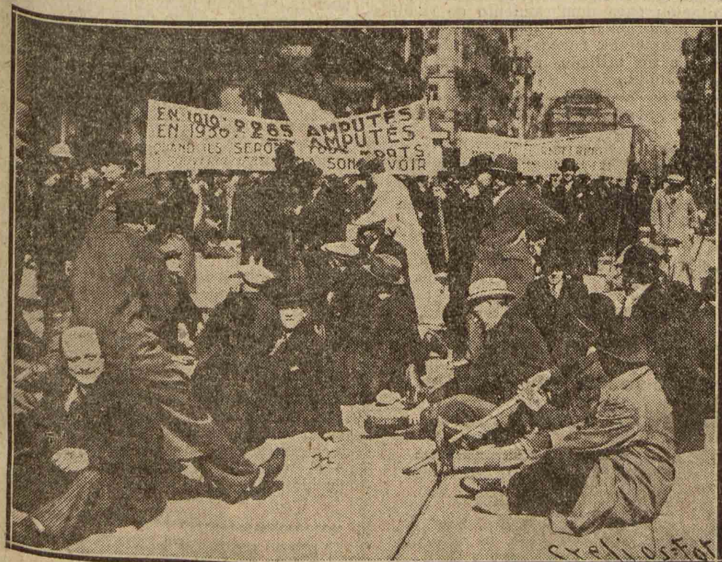
En la capital de Bélgica se han manifestado contra el Gobierno los mutilados de la Gran Guerra. No han marchado en desfile militar. Siendo soldados de lucha quedaron impedidos y han recurrido a lo que pueden: a interrumpir el tránsito sentándose en la calle

La fecha de su celebración será anunciada debidamente.