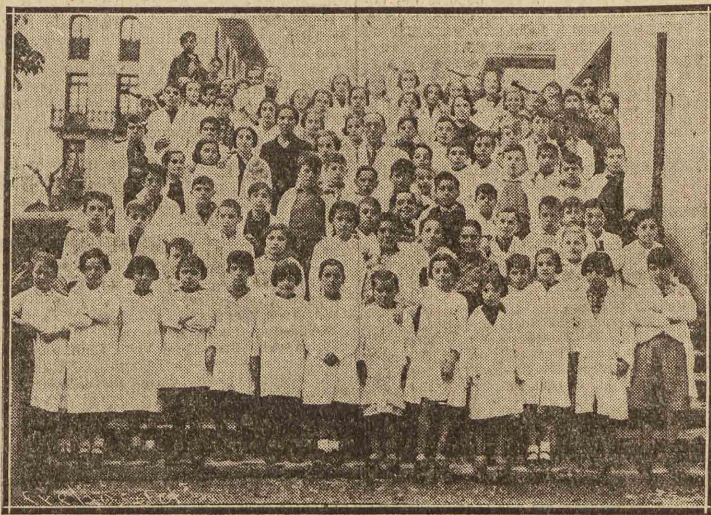
Para celebrar la fiesta del aniversario de la proclamación de la República, el Ayuntamiento de Irún obsequió con una comida extraordinaria a los ochenta niños de las Cantinas Escolares

También acordó ceder el Pueblo Español a la Sociedad Internacional de Música Contemporánea para las fiestas que organice.