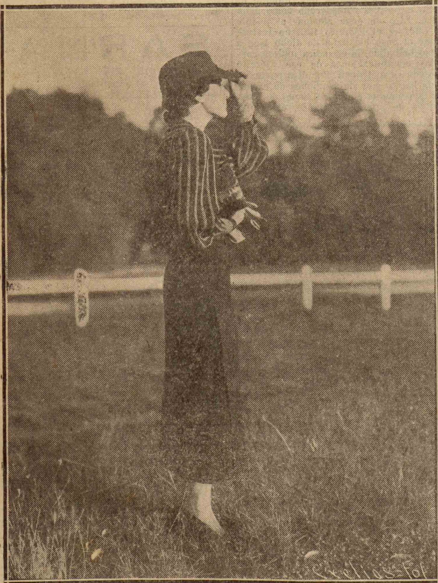
MODELO NINA RICCI.—Lana marrón: Vestido bordado en marrón y azul; abrigo guarnecido de astrakán.

Todos los comerciantes e industriales deben consultar la tarifa de publicidad de este periódico antes de hacer la propaganda de sus artículos.