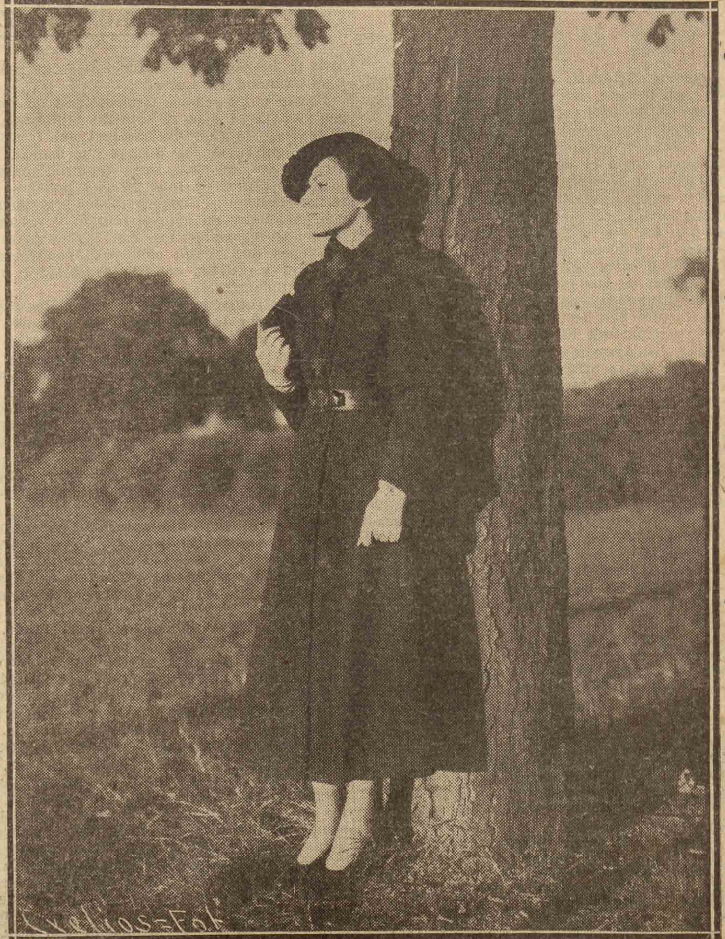
MODELO NINA RICCI.—Abrigo lana oscura guarnecido de astrakán a tono. Botones de cuero.