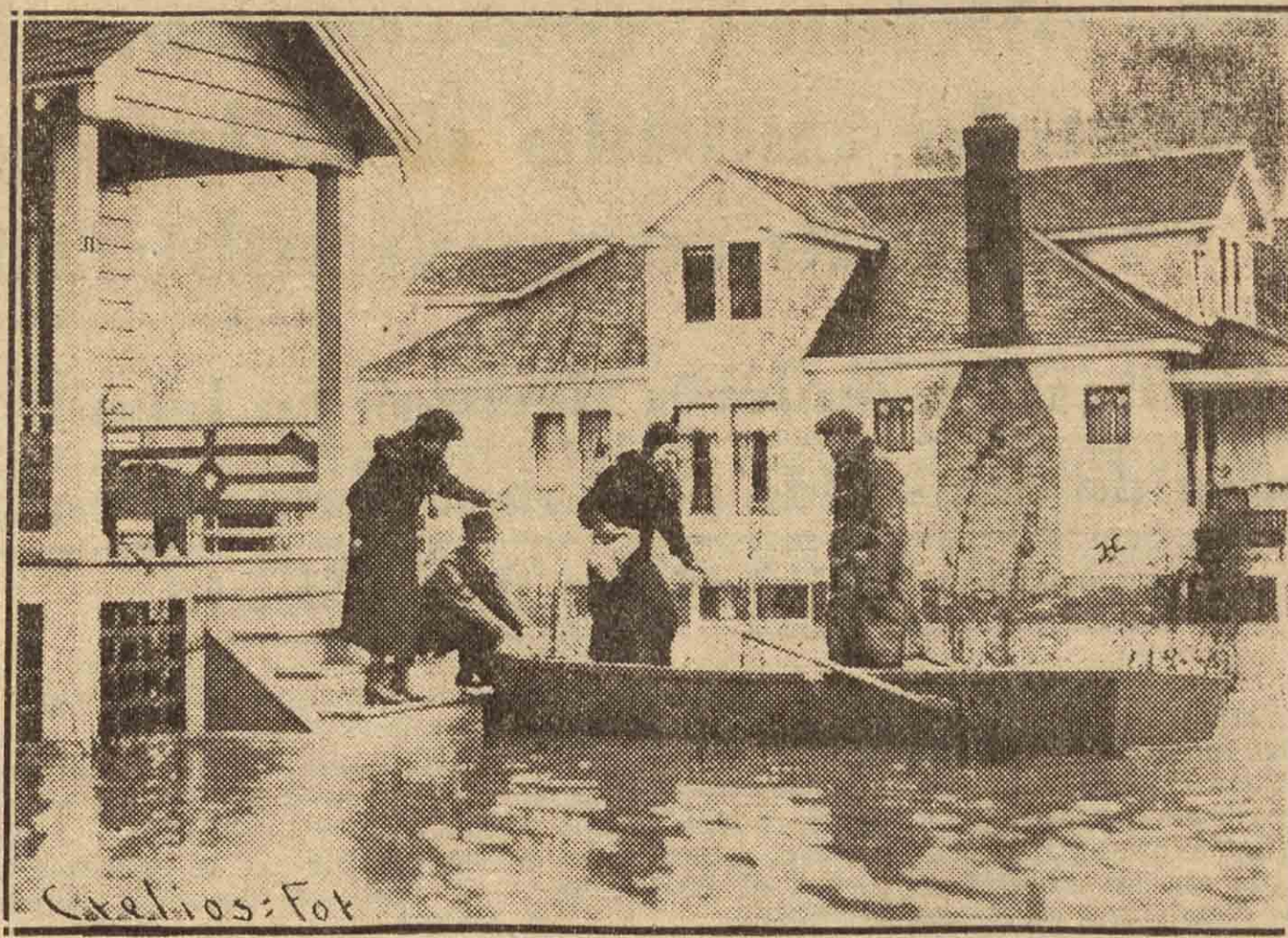
Son recuerdos para los americanos e ilustración para los europeos: En Siracusa, en el Estado de Nueva York, durante las últimas inundaciones los vecinos se vieron obligados a utilizar lanchas para poder salir de sus casas

Oficialmente se ha anunciado hoy que diez mil colonos han sido asentados sobre tierras públicas y particulares, que fueron parceladas recientemente por orden del Gobierno con el propósito de ayudar a los labradores.