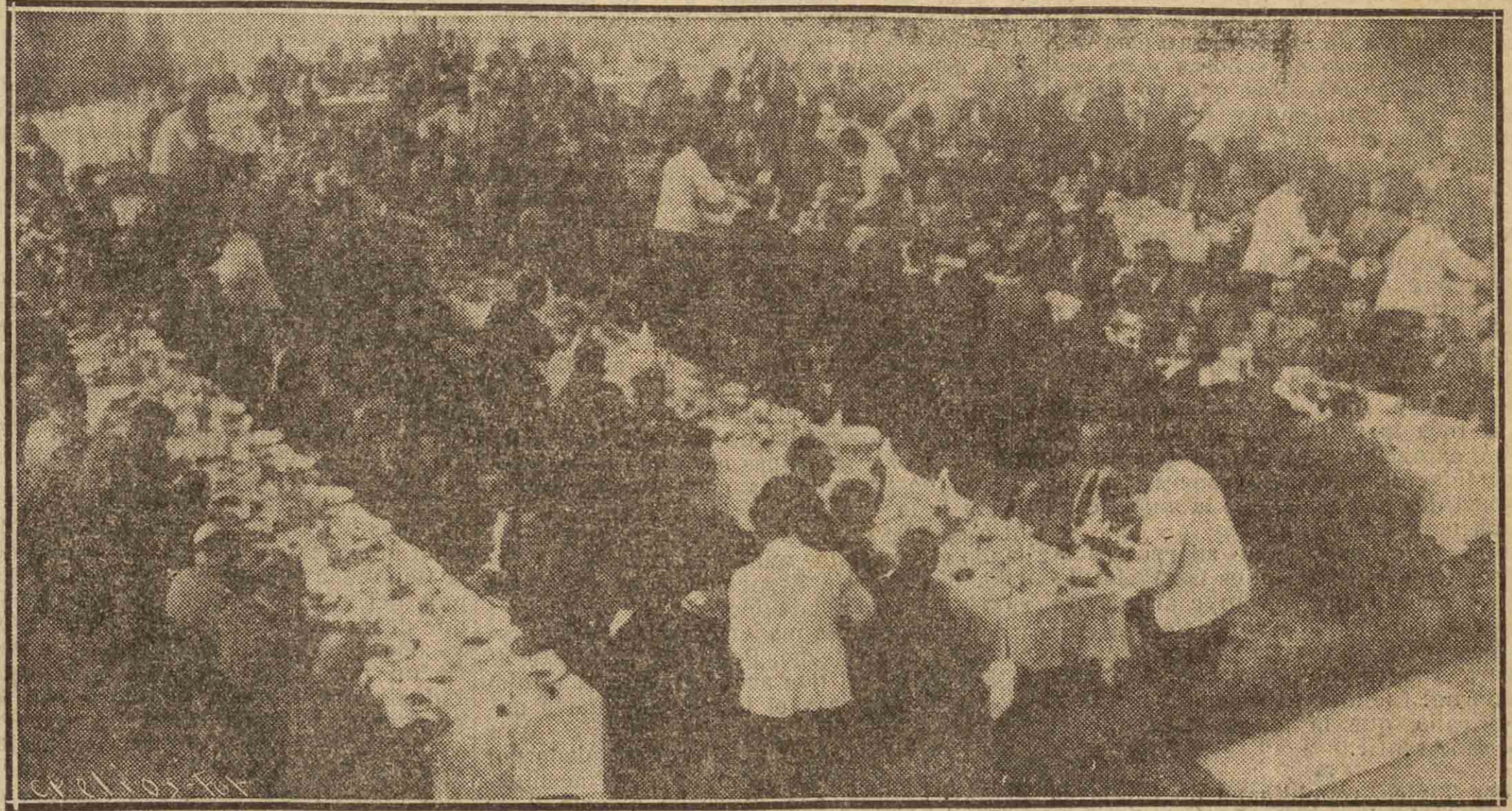
Un aspecto del "hall" de "La Perla" durante el banquete servido con motivo de la conmemoración del quinto aniversario de la proclamación de la República

La República debe ser defendida por todos, porque ella es el escudo que a todos nos defiende; a los que tienen sed de Justicia, sed de Libertad, ansias de Progreso y voluntad firme para imponer la Paz en el mundo.