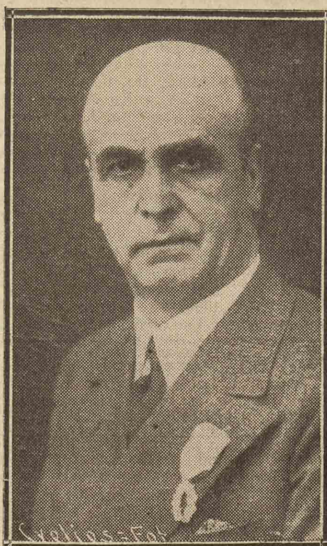
DON FRANCISCO ESCUDERO,

El Metropolitano de París tiene también una historia parecida, pues habiendo sido pagados por la ciudad los primeros gastos, los accionistas sólo acusan pérdidas, pérdidas en el negocio; pero se da el caso de que los tales accio-