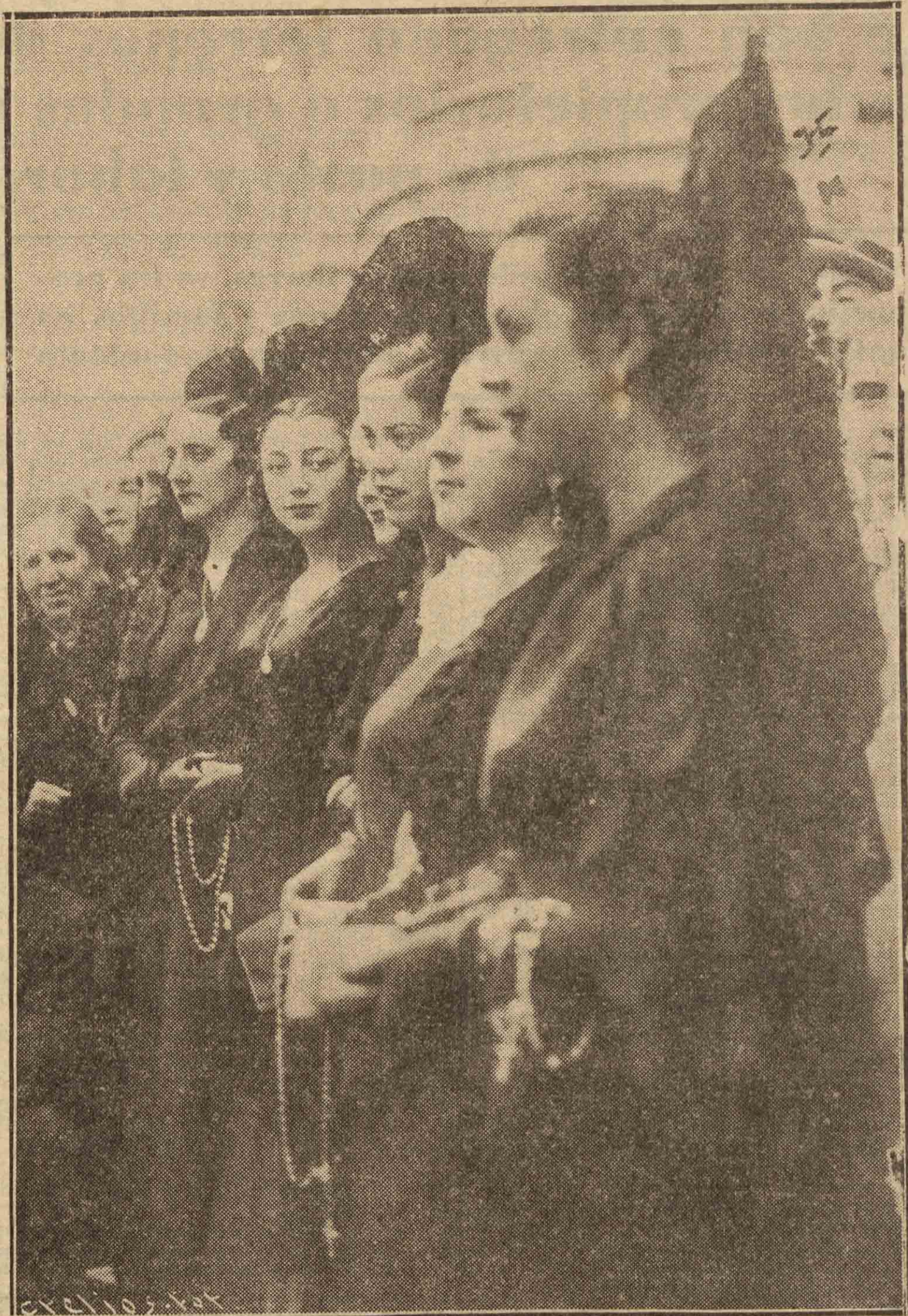
Mujer española, devoción y coquetería; cirio que alumbra con la luz de los ojos un monumento y clavel que abre sus pétalos para invadir el ambiente de la ciudad con su perfume