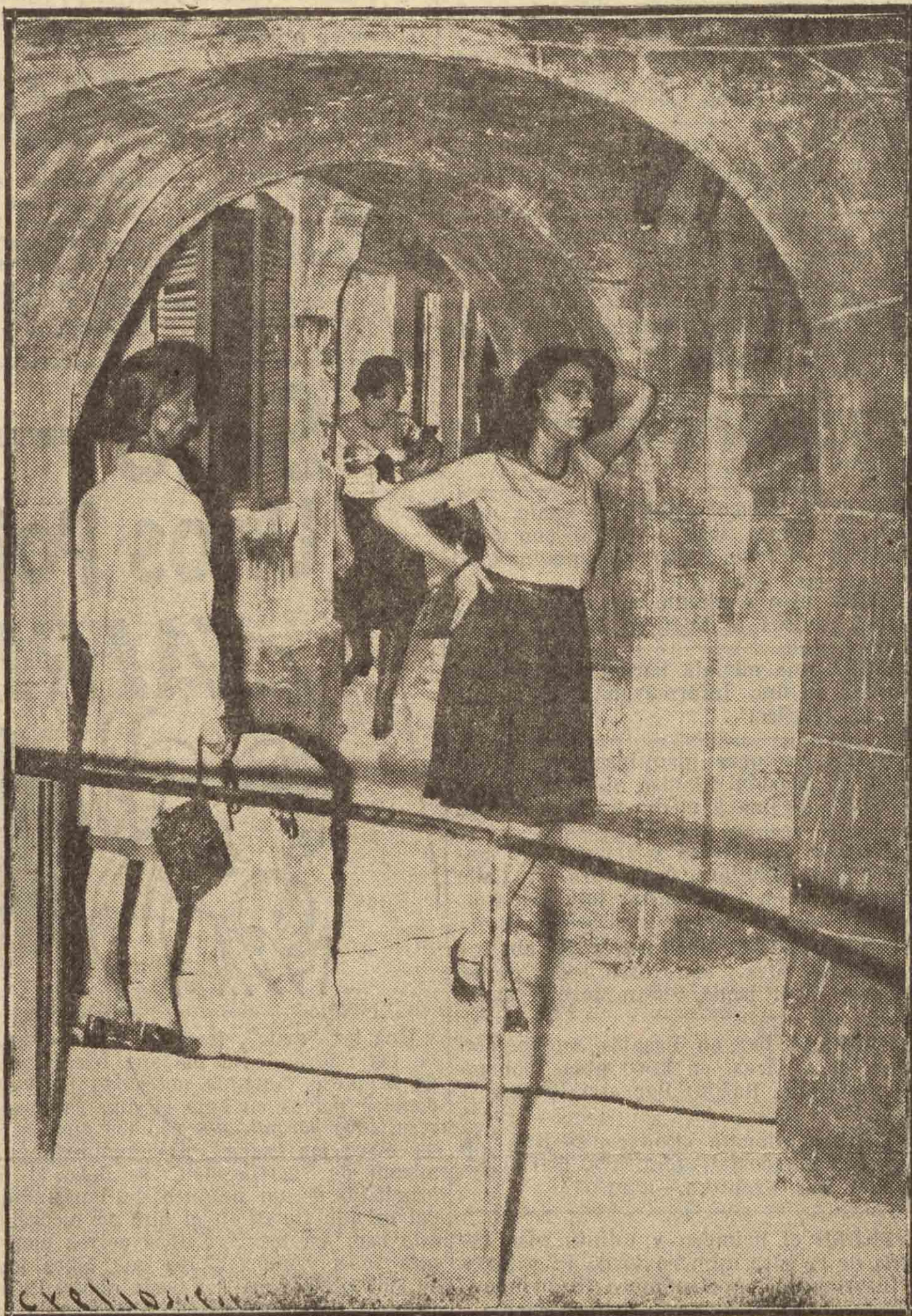
Las hetairas de la "Puerta de La Chapelle" (reproducción del Museo del Crimen)

Y después, en una serie titulada escalas a través del mundo , vitrinas consagradas a Nueva York (beodos de la época seca), a Shanghai (fumaderos de opio), a Valparaíso (tahures). Y a Buenos Aires la estampa de más subido color: la leyenda de Albert Londres ( el camino de Buenos Aires ). Es la lujuria presentada en su casa ( non sancta ), exhibición expresiva y subrayada en el catálogo: "la explotación de que son víctimas las infelices lle-