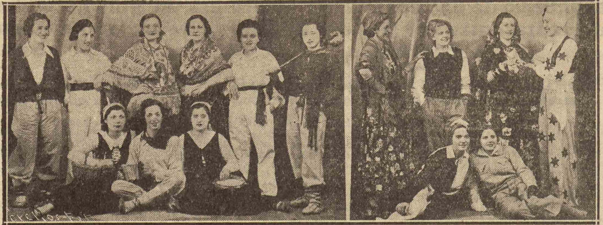
En Beasain se han celebrado las fiestas del Carnaval con el mayor entusiasmo. Hubo entusiasmo, pero también chicas guapas, como es prueba esta foto

Ayer recibió el gobernador a una representación del Colegio de Secretarios municipales, que acudió a cumplimentarla.