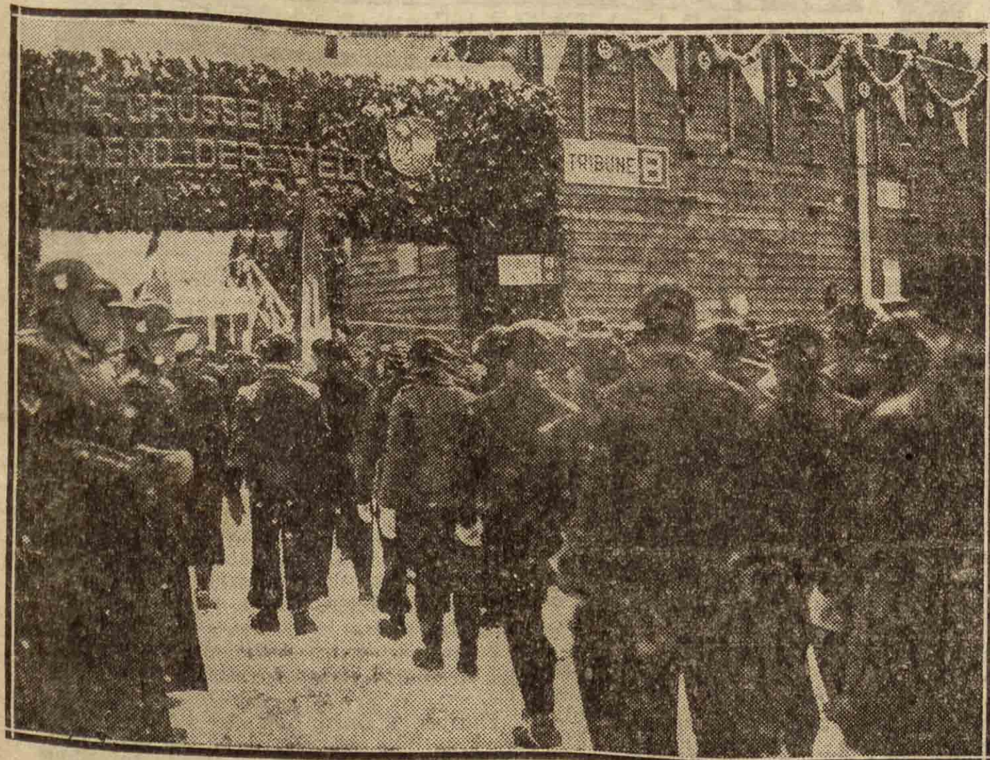
Francia ha desplazado a Garmisch gran número de personas. Pretende conseguir los puestos de honor en el sensacional torneo y para ello no ha titubeado en gastos.

CAPETOWN.—El tiempo del nuevo «record» batido por el aviador británico teniente Tomy Rose, entre Londres y esta ciudad, ha sido de 3 días 17 horas 38 minutos. Anteriormente detentaba el record la aviadora Amy Mollison, a quien Rose ha batido por 13 horas 50 minutos.