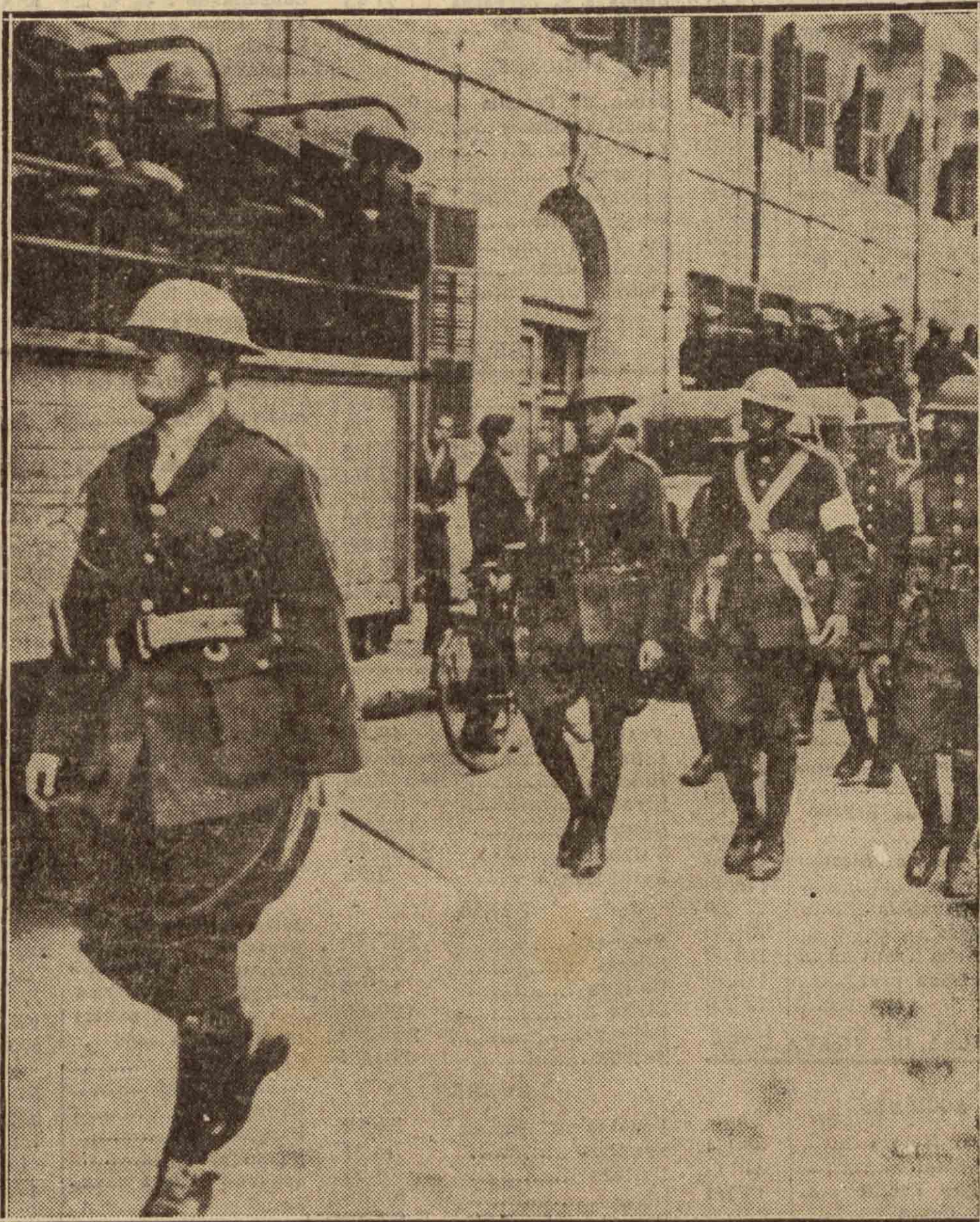
Esa actitud levantisca de los estudiantes egipcios ha obligado la intervención de las tropas. Una de las patrullas recorre las calles, en previsión de los disturbios.

Para los alumnos del plan actual que quieran acogerse al nuevo régimen de estudios se dan normas especiales.