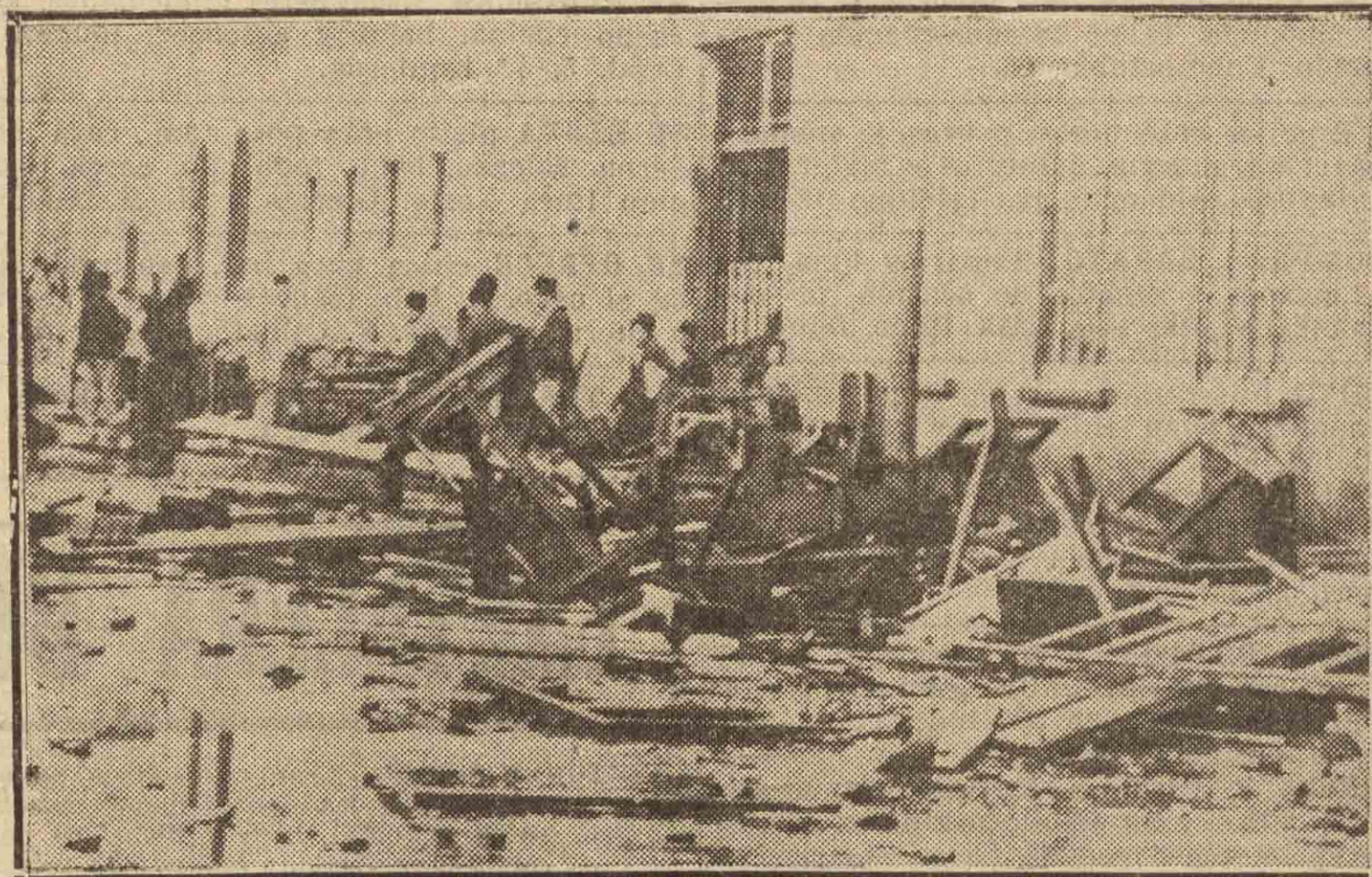
Los estudiantes egipcios han provocado serios desórdenes en El Cairo, como puede verse: todos los muebles de la Escuela de Artes Aplicadas, rotos, destrozados, después de haber sido arrojados por las ventanas a la calle.