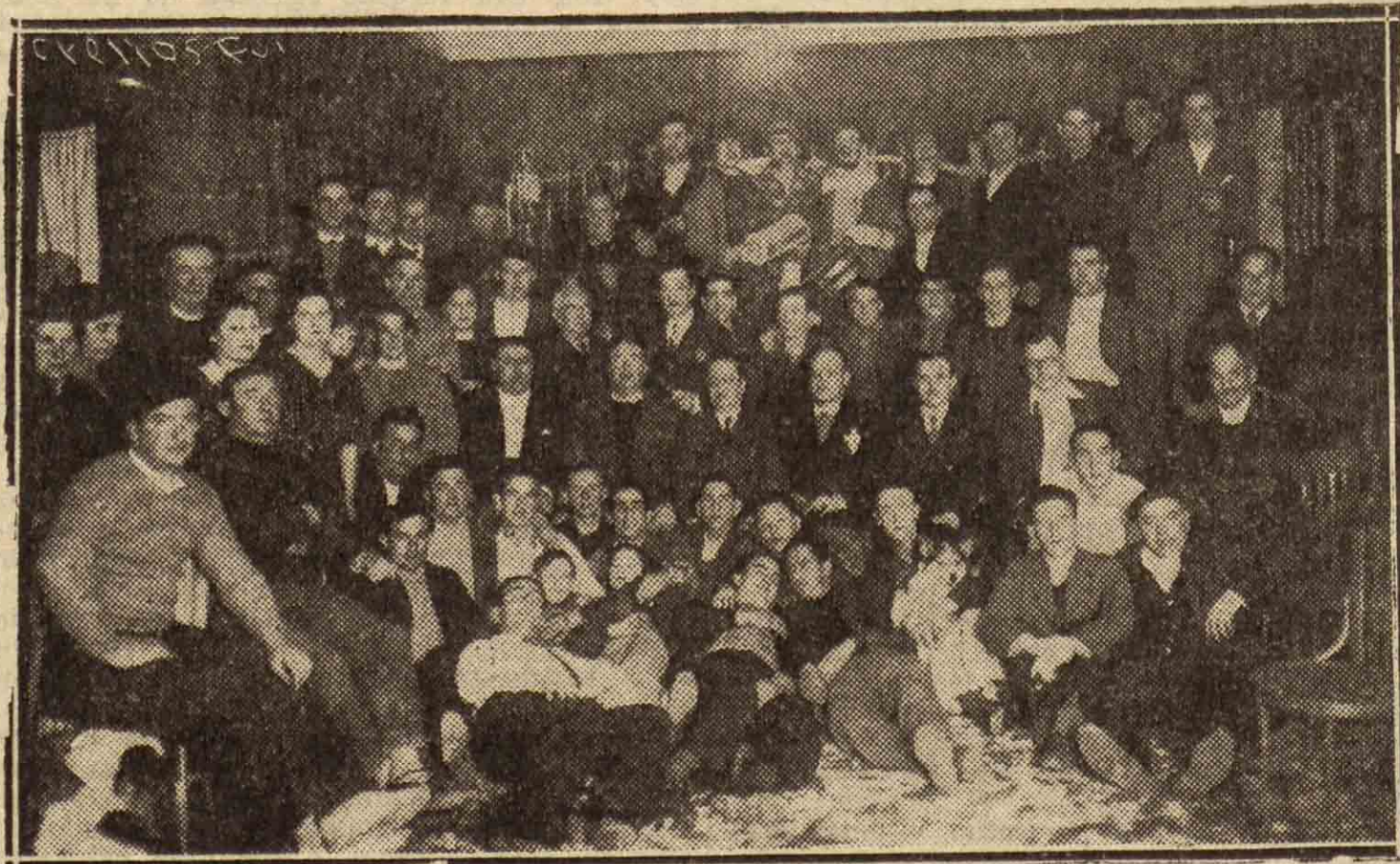
En Martutene se ha constituido otra Sociedad de carácter popular recreativo, como las del casco viejo de la ciudad. Se denomina Danak-Bat, que es muy interesante denominar euskéricamente estas Sociedades. He aquí el grupo de socios en el acto, o después del acto, de su constitución.

Les expresamos nuestro más sentido pésame.—C.