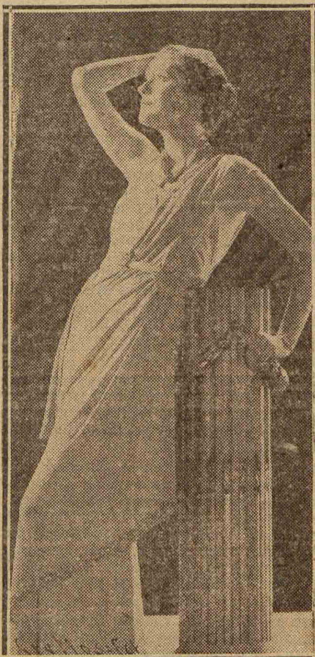
Modelo de vestido de noche lanzado en Nueva York. Estilo clásico. "Tisú" gris ribeteado con "soutache" bordados con coral, oro y cuentas turquesas