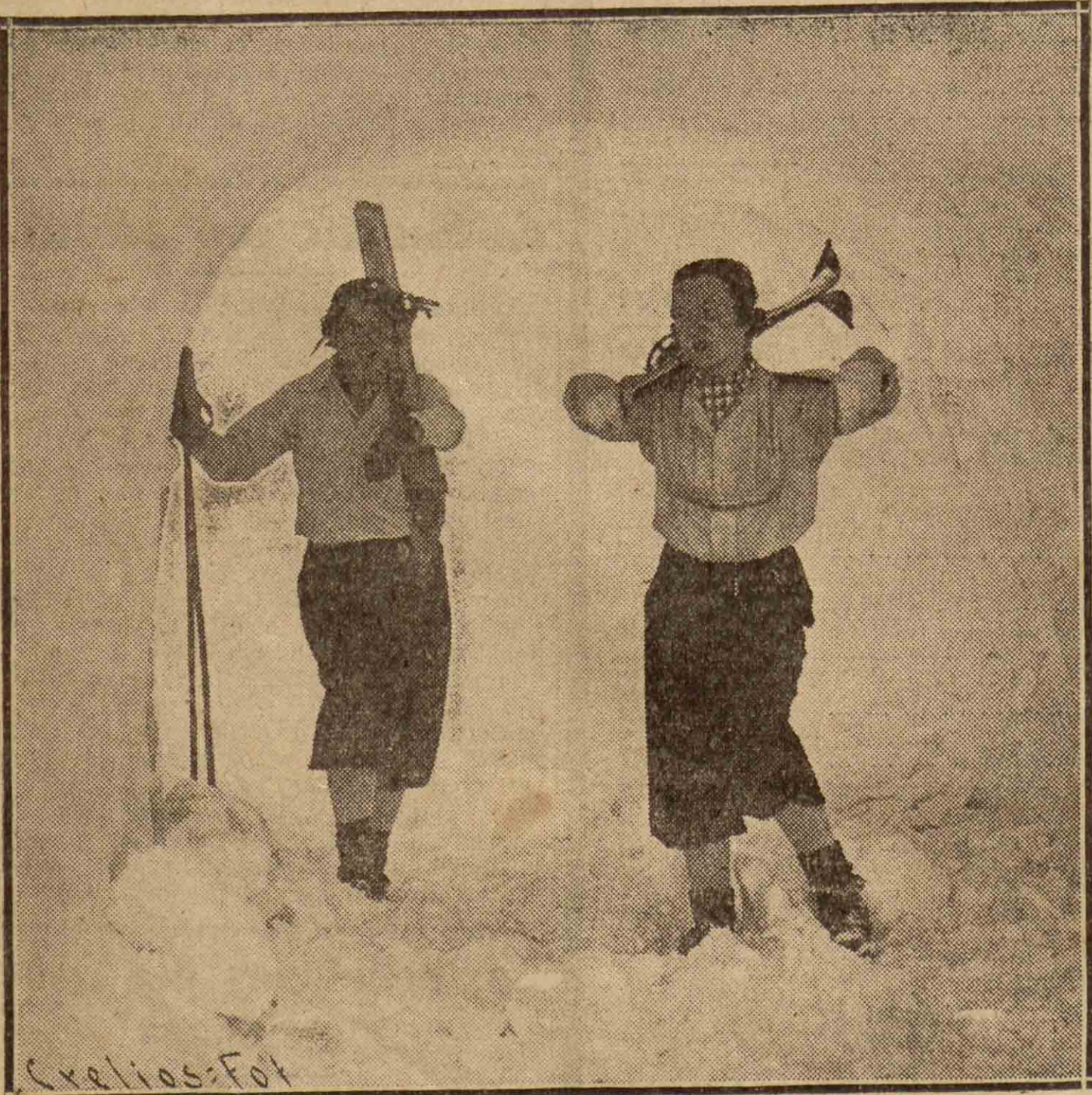
Durante diez días estuvo nevando sin interrupción en Litzbuhel, (Tyrol Austriaco), lugar donde disfrutaba de vacaciones el Príncipe de Wales; como resultado de tan gran nevada, el ferrocarril de Hahnen Ram quedó enterrado bajo una capa de nieve de veinte pies de espesor, a través de la cual hubo que abrir un túnel para que los viajeros pudieran salir a la superficie. La fotografía nos muestra a dos alegres skidoras atravesando el improvisado túnel