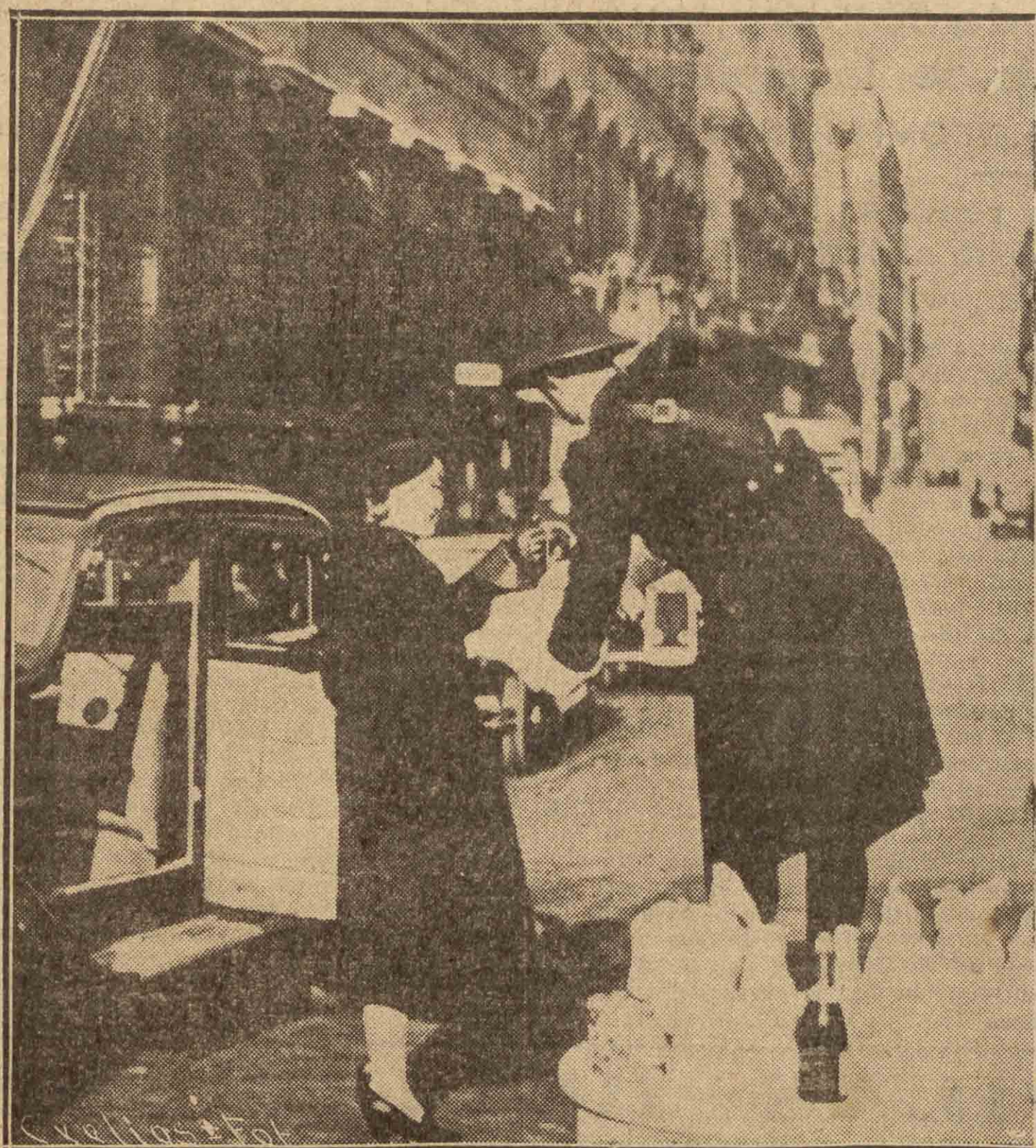
También en Roma son obsequiados los guardias de circulación, entre los cuales los hay con más que otros: éste, por ejemplo.