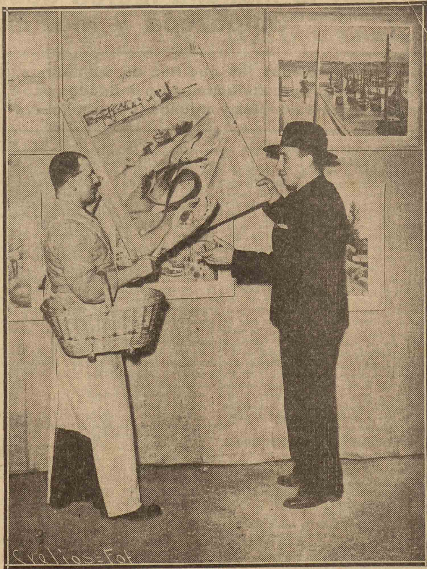
Comercio primitivo. Como no hay quien comple cuadros u otros objetos considerados superfluos, se ha establecido esta especie de mercado de trueque en el que se ve cambiar un cuadro por un jamón.