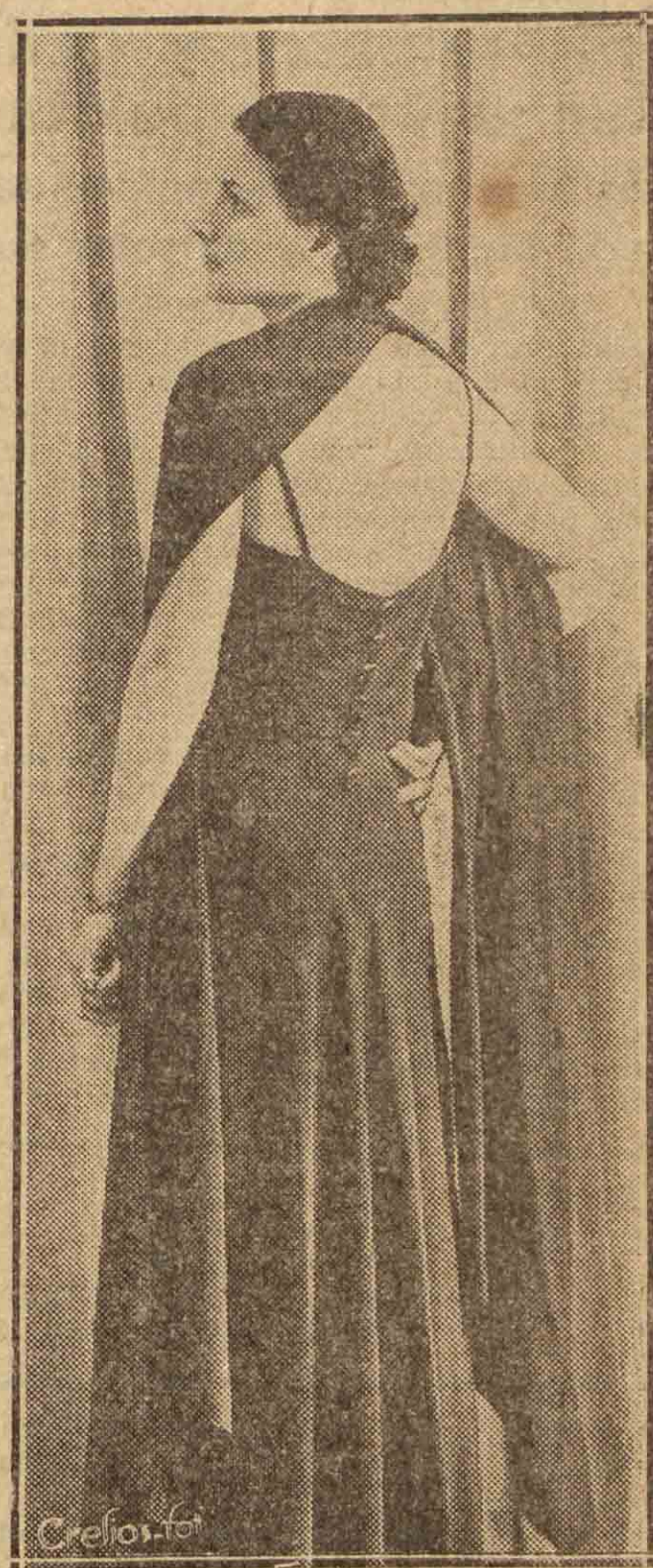
Moda de París. "Tamegra" en crepón somano color verde botella. Modelo Lucien Lelong