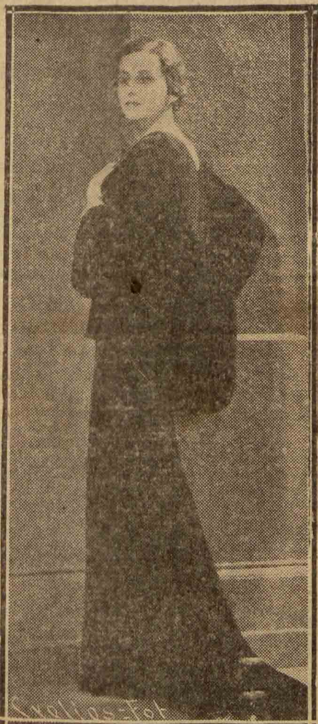
Un bello modelo de vestido de noche en terciopelo marrón, "doublé de lamé or", creación L. Manguin

Las incrustaciones de piel están muy de moda y algunos abrigos de paño soportan con mucha elegancia, sea una espalda, un canesú o voluminosas mangas de una piel suave, tal como la nutria, el astracán, el cordero raso.—N. V.