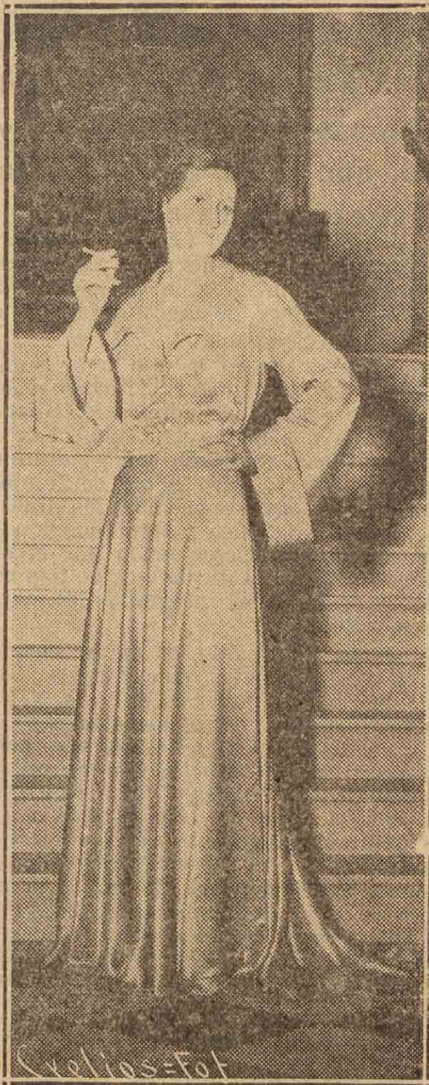
Vestido de noche lanzado en Londres. Raso en "Rosa du Barry", elegantísimo

De noche, las diademas triunfan siempre; a veces, una mariposa de seda, de múltiples colores, se coloca sobre el cierre de un abrigo, convirtiéndolo a todas las mujeres en flores graciosas, perfumadas y elegantes.