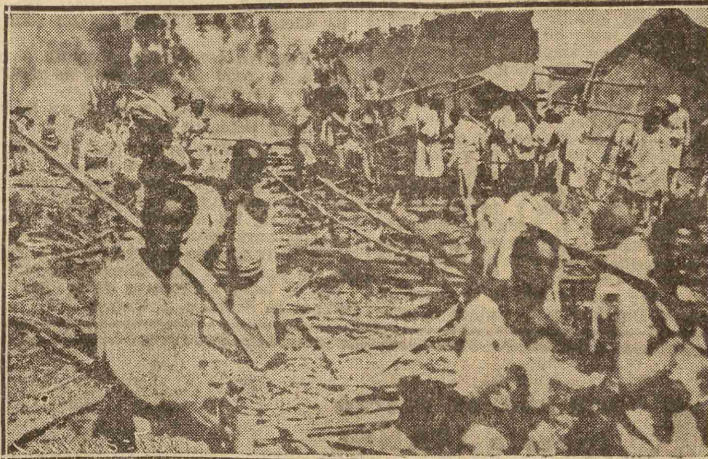
Después del bombardeo de Dessie por los aviadores italianos, los abisinios se entregan a la dolorosa tarea de buscar sus muertos entre los escombros de las chozas

Actualmente los guerrilleros etíopes hostilizan a los italianos en tres puntos diferentes en las cercanías de Makallé.